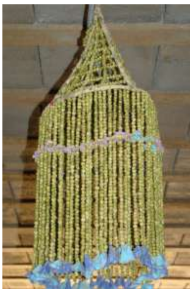
تصویر ۱۲- اسپند جهت دفع چشم‌زخم