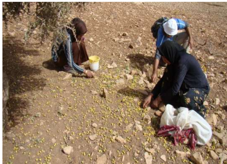
تصویر ۲ - جمع‌آوری میوه سیسه