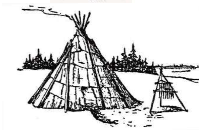
طرح ۱- ظرف آماده‌سازی آبجو