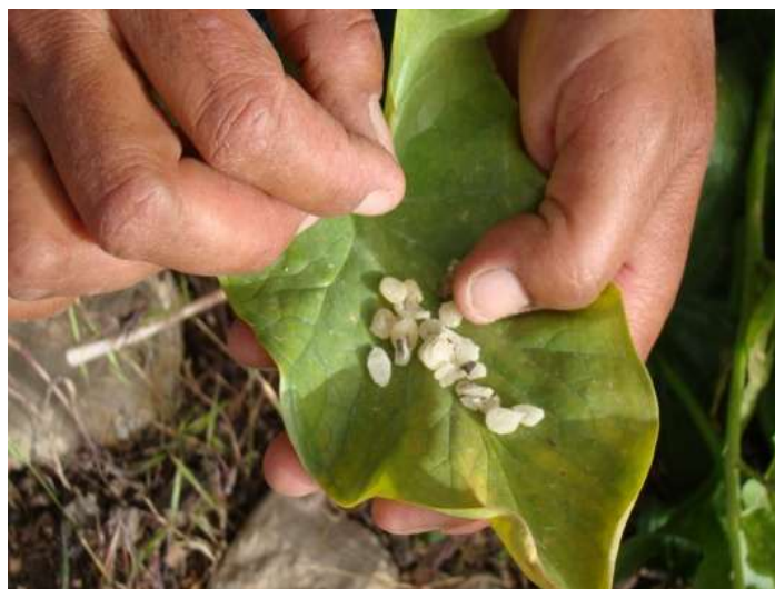
تصویر ۴ - میوه نارس بن