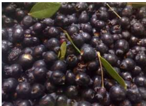
تصویر ۳- میوه رسیده مورت