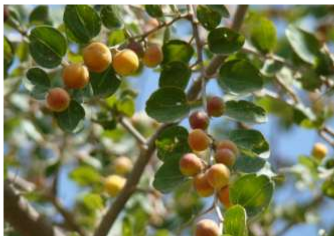
تصویر ۸- میوه کُنار