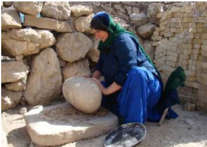
تصویر ۹- خرد کردن بلوط به وسیله سنگ بر در پیرمُشکِل

دانش بومی استفاده از گیاهان خودرو در ... ۱۳۹