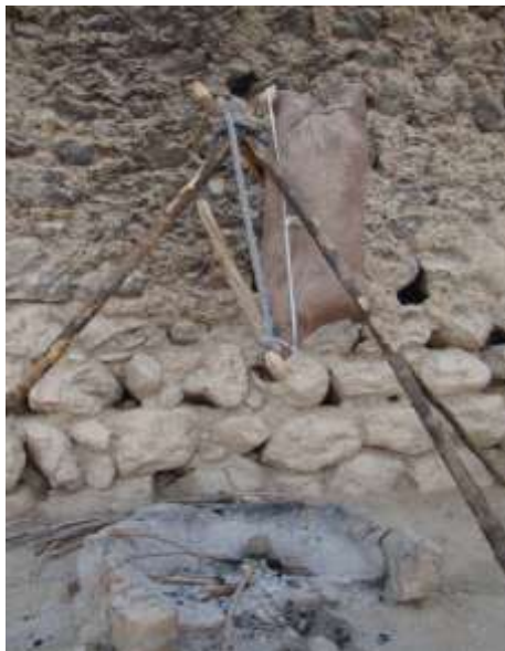
تصویر ۱۱- دود دادن مشک با چوب بلوط