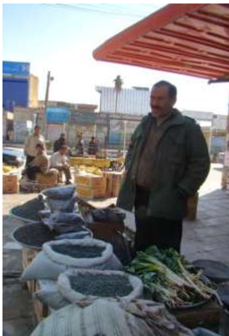
تصویر ۶- میوه کلخنگ در بازار ایذه