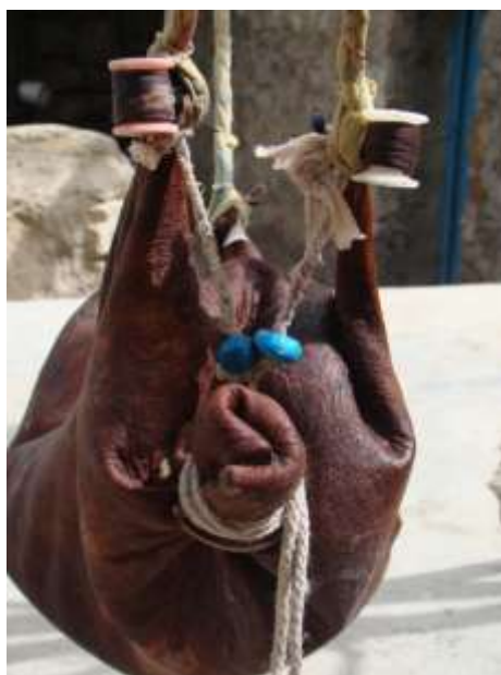
تصویر ۷- مشک رنگ شده از جفت بلوط