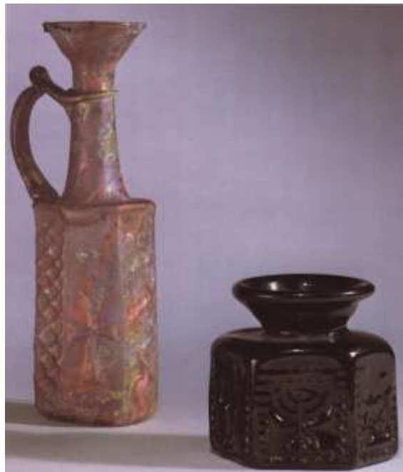
تصویر ۱- ظرف مخصوص نگهداری روغن مقدس (the history of Glass-DAN klein ward lloyd)

دانش بومی استفاده از گیاهان خودرو در ... ۱۳۵