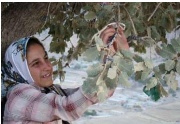
تصویر ۱۰- بستن پارچه به درخت مقدس