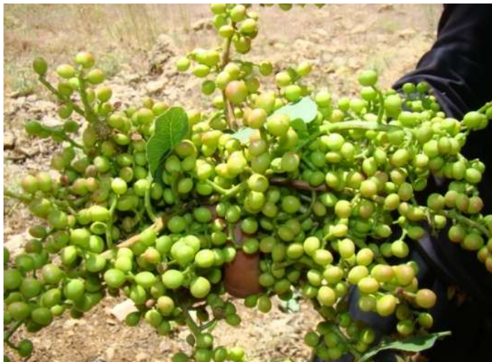
تصویر ۵- صمغ درخت بن

دانش بومی استفاده از گیاهان خودرو در ... ۱۳۷