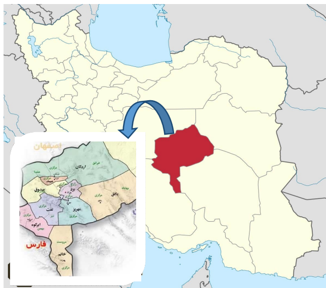
تصویر ۱- نقشه استان یزد