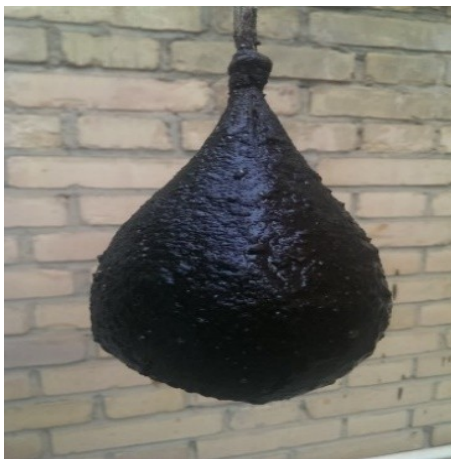
عکس ۷- راستی آزمایی روش تولید.

لایه‌گذاری بر روی قالب پارچه‌ای را آن‌قدر ادامه می‌دهند تا ضخامت اندود به یک سانتیمتر برسد. در میانه اندود و اضافه کردن لایه‌ها، قبل از آنکه ضخامت اندود به یک سانتیمتر برسد، هنگامی که ضخامت لایه‌ها به حدود پنج میلی‌متر رسید دو قطعه چوب را که از قبل به شکل دسته کوزه تراشیده‌اند، بر روی اندود می‌چسبانند و روی آنها را نیز، همانند سایر قسمت‌ها می‌پوشانند. (عکس ۸ و طرح ۱)