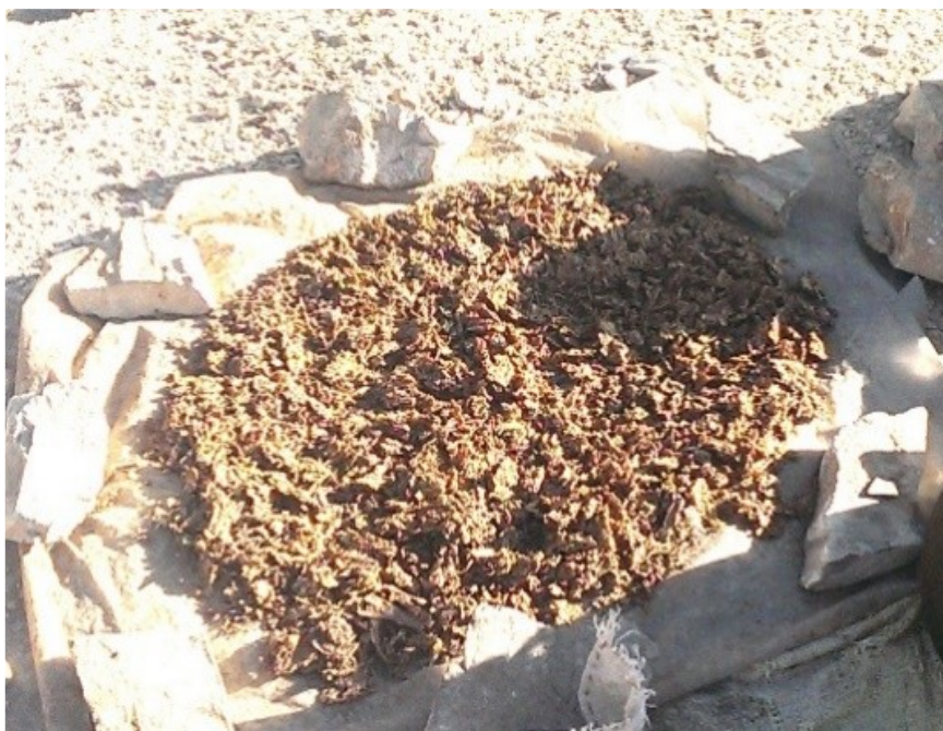
عکس ۳- آماده‌سازی لوه.

در شهرستان کوه‌رنگ از ساقه تازه رسته لوه در فصل بهار برای مصارف غذایی استفاده می‌گردد؛ اما در روستای صالح کوتاه از چیدن گیاه مذکور، تا اوایل تابستان خودداری و زمانی که گیاه پیر و در حال خشک شدن است، آن را از ریشه خارج نموده و ساقه آن را برای مصارف غذایی و ریشه آن را برای ساخت بوکله مهیا می‌کنند. به دلیل اینکه احشام تمایلی به چرای این گیاه ندارند، در فصل بهار، منطقه پوشیده از این گیاه می‌شود. پس از جمع‌آوری، شستشوی گیاه و زدودن گرد و خاک و گِل از ریشه، ریشه‌ها را به مدت دو هفته در مقابل نور آفتاب پهن نموده تا کاملاً خشک گردند. (عکس ۳)