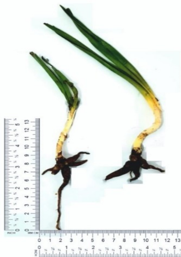
عکس ۲- ریشه لوه. چهارم حال و بختیاری.