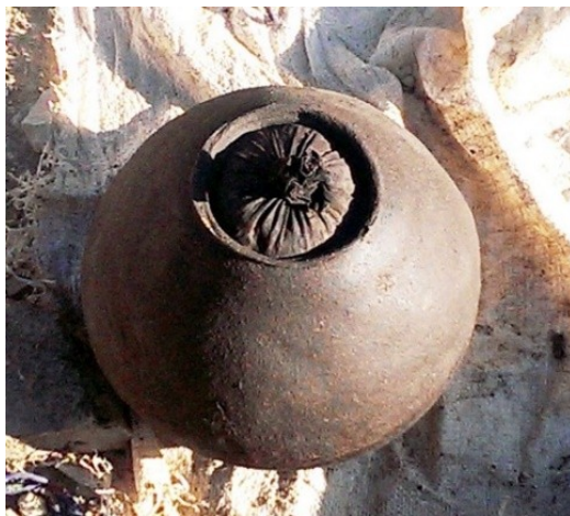
عکس ۱۱- بوکله در پایان اندود کردن قالب.

پس از خارج نمودن کیسه پارچه‌ای، درون ظرف را به وسیله اندودی از جنس بدنه می‌پوشانند، تا علاوه بر، برطرف نمودن رد پارچه، داخل ظرف همانند بیرون آن صیقلی گردد. هم‌زمان با صیقلی نمودن درون ظرف، برای آن، دری از چوب می‌تراشند و همانند دسته‌ها، اندود می‌نمایند. (عکس ۱۱) سپس ظرف را به مدت یک هفته دیگر در معرض هوای آزاد قرار می‌دهند تا کاملاً خشک و سخت گردد. (عکس ۱۲)