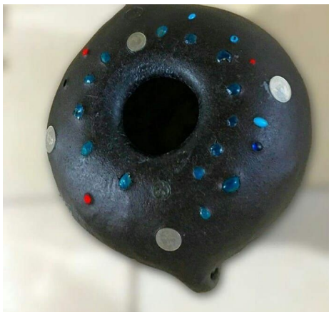
عکس ۹- تزئینات بوکله.

بعد از کامل شدن تمامی مراحل، ظرف را در همان حالت آویزان، به مدت یک هفته در معرض نور آفتاب قرار می‌دهند، تا کاملاً خشک گردد. با گذشت حدود یک هفته، بدنه ظرف همانند سنگ سخت می‌گردد. در این هنگام ظرف را از محل خود پایین آورده و پس از باز کردن قالب پارچه‌ای، خاک درون قالب را تخلیه و به آرامی کیسه خالی شده از خاک را از داخل ظرف جدا نموده و آن را خارج می‌نمایند. (عکس ۱۰)