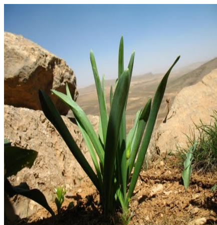
عکس ۱- گیاه لوه. چهارم حال و بختیاری.

ارزش نهادن و تقدس برخی از مواد خوراکی در نزد بختیاری ها یکی از جنبه های فرهنگی آنها به شمار می رود. موادی مانند: گندم، نمک، شیر (و فرآورده های آن) و عسل، که اصطلاحاً به آنها غذاهای فوق فرهنگی گفته می شود؛ در نزد مردمان این قوم از جایگاه ویژه ای برخوردار است. آن ها مانند سایر اقوام بدوی «غذاهای به اصطلاح فوق فرهنگی را همچون هدایای خدایان تلقی می کنند» (دوگارین، ۱۳۶۶: ۷-۴) و از این مواد به عنوان هدایای ویژه خداوند یاد می شود. در فرهنگ بختیاری، هر گونه رفتار و کنشی که به معنای خوار شمردن و بی احترامی به خوردنی ها باشد، مردود می شمارند. از این رو، تهیه ظروف، برای حفظ و نگهداری مواد غذایی و احترام به هدایای الهی است.