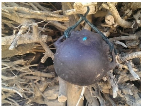
عکس ۱۲- بوکله در حال خشک شدن.