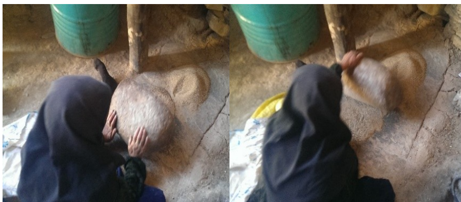
عکس های ۴ و ۵- آسیاب ریشه خشک شده لوه.

سپس ریشه‌های خشک شده را به وسیله آسیاب سنگی (برده‌ر) ۱ خرد می‌نمایند. (عکس ۴ و ۵) پس از آسیاب نمودن ریشه‌ها، را بر درون مدور و مقعر فلزی به نام (توه) تا به ۲ که از پشت آن برای پخت نان استفاده می‌کنند حرارت می‌دهند، تا رطوبت باقی مانده در داخل این ریشه‌ها کامل از بین برود. دوباره آنها را آسیاب نموده تا پودر یکنواختی پدید آید. محصول این فرآیند پودری است، که پس از اضافه نمودن آب به آن تغییر رنگ داده و محلول تیره‌ای تولید می‌شود که به عنوان ماده اصلی بدنه ظرف بوکله مورد استفاده قرار می‌گیرد.