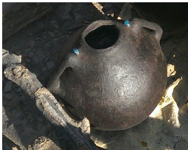
عکس ۸- دسته و فرم کلی لوه.

لایه‌گذاری بر روی قالب پارچه‌ای را آن‌قدر ادامه می‌دهند تا ضخامت اندود به یک سانتیمتر برسد. در میانه اندود و اضافه کردن لایه‌ها، قبل از آنکه ضخامت اندود به یک سانتیمتر برسد، هنگامی که ضخامت لایه‌ها به حدود پنج میلی‌متر رسید دو قطعه چوب را که از قبل به شکل دسته کوزه تراشیده‌اند، بر روی اندود می‌چسبانند و روی آنها را نیز، همانند سایر قسمت‌ها می‌پوشانند. (عکس ۸ و طرح ۱)