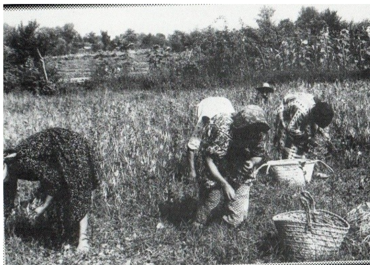
عکس ۲- یاوری زنان در برداشت حبوبات و صیفی‌جات باغ‌های لشت نشاء (عباسی، ۱۳۸۱: ۲۳۰)

یا محدوده‌های دایره‌ای را برای کاشت تخم خیار و کدو و هندوانه و خربزه آماده کرده و تخم ترب و شاهی می‌افشانند. در هر حال پیش از آن زمین شخم زده با کج بیل ریز و هموار و گیاهان نامطلوب پاک می‌شود، کاری که به صورت گروهی و با کمک دیگران انجام می‌گردد. این مراسم در مناطقی است که به صورت سنتی اراضی را کشت می‌کنند، در جاهایی که از تراکتور و ماشین‌های تخم برای تولید استفاده می‌شود و باغداری مکانیزه شده از این سنت خبری نیست.