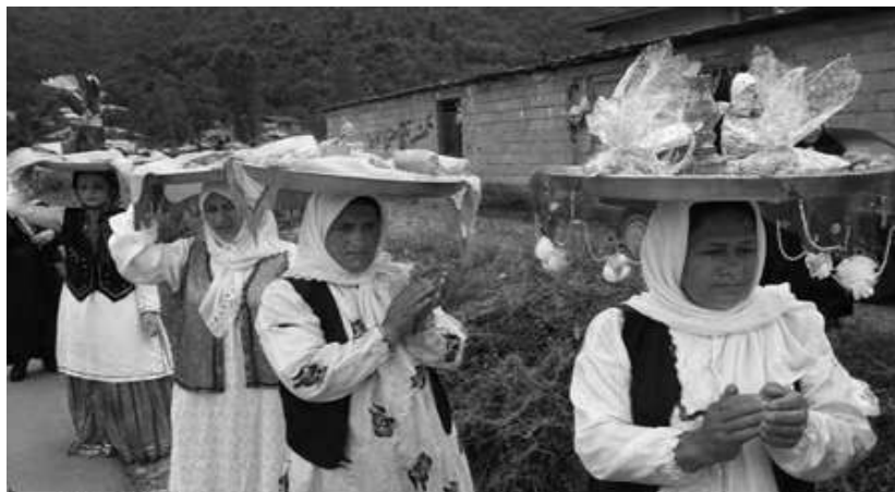
عکس ۵- بی نام، گزارش برداشت و بخت نیشکر در صومعه سرا، ۱۰ بهمن ۱۳۹۲