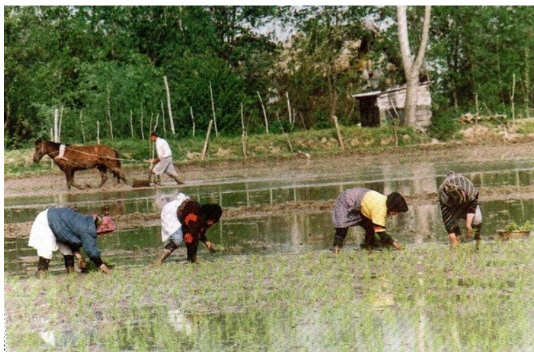
عکس ۱- زنان گیلانی در حال نشاء در مزارع برنج منطقه لشت نشاء (عباسی، ۱۳۸۱: ۲۱۷)

در این بخش به گوشه‌ای از ویژگی‌های جمع‌گرایانه و مشارکتی و تعاون و همیاری سنتی در میان زنان گیلانی اشاره خواهد شد.