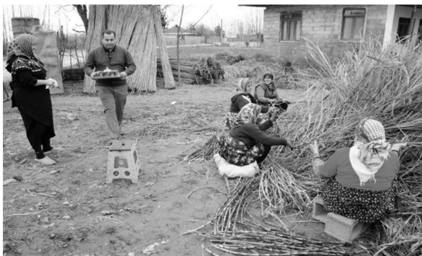
عکس ۴- بی‌نام، گزارش برداشت و پخت نیشکر در صومعه‌سرا، ۱۰ بهمن ۱۳۹۲، اقتباس از:

یاوری در دروی نیشکر در روستاهای لنگرود و صومعه‌سرا، از آیین‌های سنتی و مردمی منطقه است که زنان و مردان روستا در اقدامی مشترک در آن شرکت دارند. نه تنها دروی نیشکر که استخراج عصاره و پختن آن هم با تعاون انجام می‌گیرد، چرا که اگر کار به تعویق بیفتد. نیشکر خشک و کم آب می‌شود و زحمات کشاورزان بر باد می‌رود.