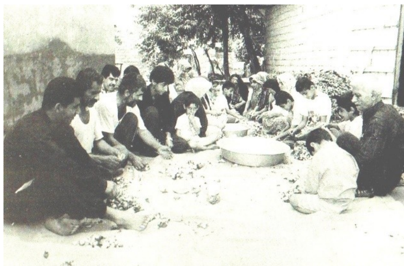
عکس ۳- پيله چینی یاور، لشت نشاء گیلان (عباسی، ۱۳۸۱:۲۲۸)

صاحب تلمبار نوغان را در اطراف محل پرورش نوغان یا داخل حیاط خانه‌اش زیر سایهٔ درختان حصیر یا زیرانداز پهن می‌کند. پیرمردان و جوانان و کودکان یک‌طرف و زنان و دختران در طرف دیگر می‌نشینند. یاوران پس از «مبارک باد» گفتن به صاحب تلمبار شروع به چیدن و تمیز کردن پيله می‌نمایند. در طول انجام کار صاحب تلمبار از یاوران با چایی و انواع خوردنی پذیرایی می‌کند.