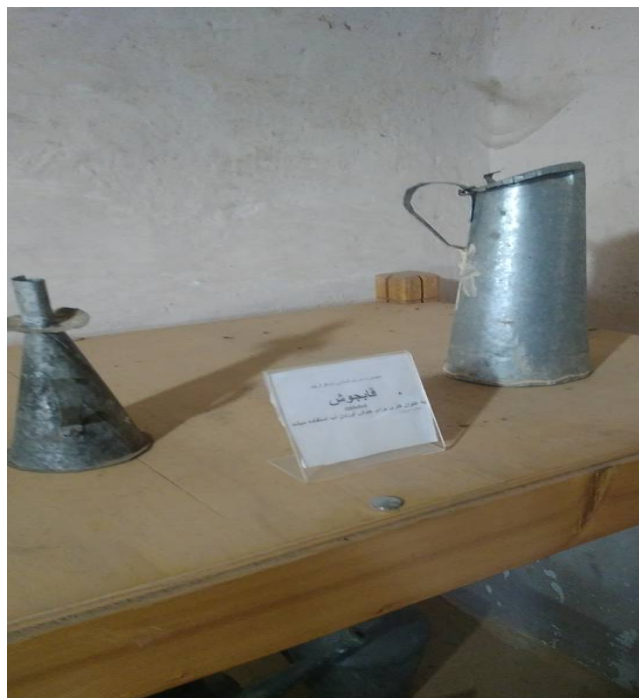
عکس ۶- قابجوش، موزه مردم‌شناسی برسه، دوهزار، تیر ۹۷

در تمام منازل پس از سوختن هیزم‌ها و پیش از خاکستر شدن آن با کنار گذاشتن تکه‌های چوب مشتعل و گاهی با ریختن آب بر روی آتش اقدام به تهیه ذغال و جمع‌آوری آن می‌کنند. زغال‌ها را در ظرف‌های حلبی و یا کیسه جمع‌آوری می‌کنند و هر زمان که می‌خواستند از آن استفاده می‌کردند. ابتدا زغال‌های خاموش را در منقل و یا گاهی اوقات در کوره فرنگی می‌ریختند و سپس آتش می‌زدند و پس از گداخته کردن آن که اصطلاحاً به این زغال‌های گداخته، چیک ۱ می‌گویند استفاده می‌کردند. کوره فرنگی اجاقی کوچک از گل و سنگ و گهگاه با چند میله آهنی نازک درست شده که در کنار کرچال