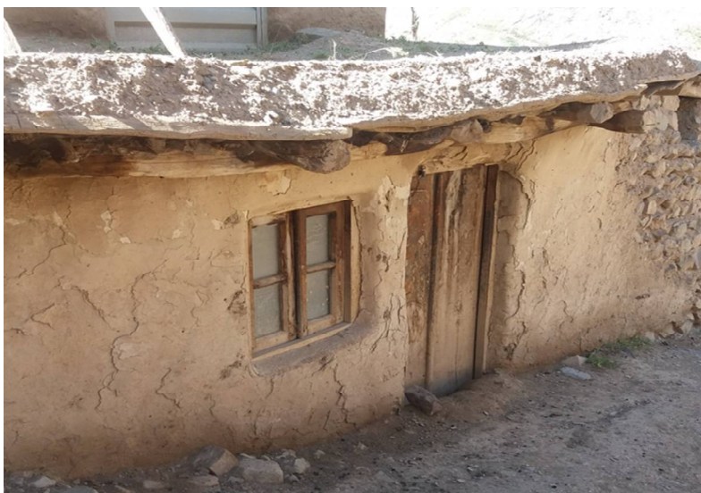
عکس ۱۱- خانه سنگ‌چین، روستای درجان، سه هزار، فروردین ۹۷

با سنگ و گل می‌ساختند که به این خانه‌ها سنگ‌چین می‌گفتند. این خانه‌ها دارای دیوارهایی با عرض زیاد بودند که در فصول سرد برای حفظ گرمای حاصله از سوخت‌ها بسیار مؤثر بودند (عکس شماره ۱۱).