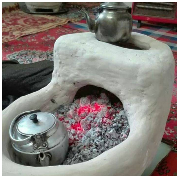
عکس ۸- کوره فرنگی در منزل یکی از اهالی روستای دو هزار در حال استفاده کردن،