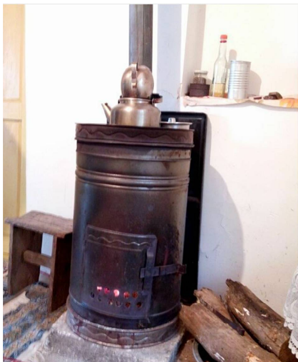
عکس ۱۲- بخاری هیزمی، روستای سه هزار، فروردین ۹۷.

می‌شد. پس خانه دارای روزنه‌ای بود که از آن نور وارد خانه می‌شد. شب‌ها دیگر آتش روشن نبود و روزنه کاملاً بسته می‌شد. آتش حاصل از هیزم، خانه را کاملاً تا صبح گرم نگه می‌داشت. با رایج شدن بخاری‌های هیزمی (عکس شماره ۱۲) کرچال‌های داخل پس‌خانه جای خود را به آن دادند و دیگر پخت‌وپز در کرچال‌های تعبیه شده بر روی ایوان صورت می‌گرفت. دیگر دودی که از سوختن هیزم در کرچال‌ها تولید می‌شد موجب آزار و بروز بیماری‌های تنفسی ساکنین منطقه نمی‌شد و نسبت به گذشته از رفاه نسبی برخوردار شده بودند.