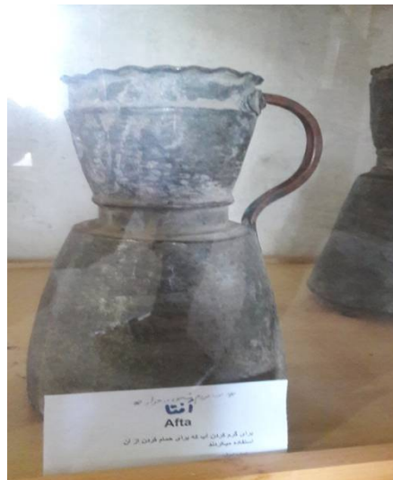
عکس ۱۵- افتا ۱ ، موزه مردم‌شناسی برسه، دوهزار، تیر ۹۷

بیش از هشتاد سال است که نفت وارد دهستان‌های دوهزار و سه هزار شده. ساکنین این دهستان‌ها برای تهیه نفت به شهر مسافرت می‌کردند و به‌صورت کوله‌بار (کولبری) و یا با کمک اسب و قاطر، نفت را صرفاً جهت استفاده در چراغ‌های روشنایی به روستاهای خود می‌رساندند. بعدها با تشکیل تعاونی‌های روستایی نفت از طریق این تعاونی‌ها تهیه و توزیع می‌شد. بعدها با احداث جاده و اتومبیل، نفت را با تانکرهای بزرگ به این دهستان‌ها منتقل می‌کردند و توسط تعاونی‌ها با تانکرهای کوچک‌تر بین اهالی توزیع می‌گردید. بعد از سهمیه‌بندی نفت و گازوئیل هر خانوار با ارائه دفترچه عضویت و بعدها با ارائه کوپن سهمیه نفت خود را دریافت می‌کردند. ساکنین این دهستان‌ها برای آنکه در فصل سرما دچار کمبود نفت و مواد سوختی نشوند در دیگر