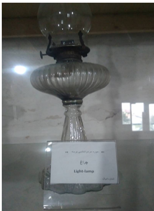
عکس ۱۹- لمپا ۷، موزه مردم‌شناسی برسه، دوهزار، فروردین ۹۷، عکس: محققان

لمپا ۱ : این چراغ‌ها از جنس سفال یا شیشه بودند که شامل پایه، مخزن نفت و محل اتصال فتیله یا معجر ۲ و شیشه بود. لمپاها بسته به اندازه و شکل معجر آنها به لمپا هفت و لمپا ده و گردسوز تقسیم‌بندی می‌شدند. لمپاهای هفت، نور کمتر از لمپاهای ده داشتند و فتیله هر دو مستطیل شکل بود. چراغ‌های لمپا گردسوز به دلیل داشتن فتیله‌های گرد که از دور معجر بالا کشیده می‌شدند نور بیشتری از دیگر لمپاها داشتند. بعدها در ساخت این چراغ‌ها از حلب استفاده می‌کردند (عکس‌های شماره ۱۹ و ۲۰).