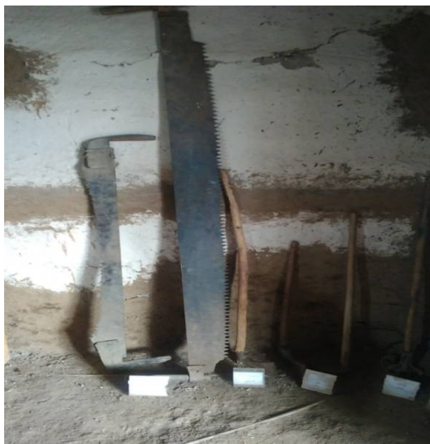
عکس ۵- تبر و اره کله بر، موزه مردم‌شناسی برسه، دوهزار، فروردین ۹۷

چون فضولات حیوانی کم بود و همیشه نمی‌شد از آن استفاده کرد برای تهیه هیزم راه زیادی را تا جنگل می‌رفتند و با اسب و قاطر، هیزم به خانه‌های آوردند. در گذشته از هیزم برای پخت‌وپز استفاده می‌کردند. برای تهیه هیزم زیاد اغلب با یک نفر که آشنا تر به جنگل بوده و محل افتادن درخت‌های خشک را می‌دانسته صحبت می‌کردند و آدرس آنجا را می‌گرفتند. برای بریدن و قطعه‌قطعه کردن درخت در گذشته از تبر یا اره‌هایی بلند به نام کله بر ۱ که دارای دو دسته در دو سوی اره بود استفاده می‌شد که بعضی خانواده‌ها از این نوع اره در منازل خود داشتند. بعدها برای این کار از اره موتوری استفاده می‌شد که در هر روستا فقط یک یا دو نفر که کارشان نجاری و یا کاری مشابه آن بود نسبت به تهیه آن اقدام کرده بودند (عکس شماره ۵).