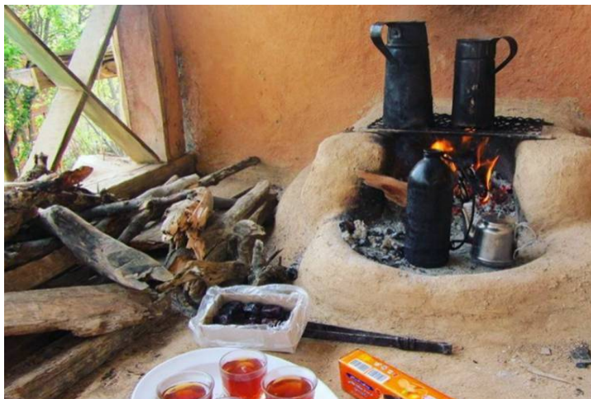
عکس ۱۰- کرچال، خانه روستایی، دوهزار، تیر ۹۷

استفاده از سوخت‌های سنتی سبب می‌شد که اعضا خانواده برای استفاده از نور و گرمای بیشتر، در یک اتاق و نزدیک به هم بنشینند. غالباً بزرگ‌ترها مکان معینی برای خود در هر خانه داشتند. به‌طور مثال پدر خانه در کنار کرچال (عکس شماره ۱۰) می‌نشست و مادر خانه اغلب در جلوی کرچال و مشغول گرم نگه‌داشتن غذا و آماده کردن آن بود. به همین ترتیب جایگاه پسر ارشد و دیگر فرزندان با کمترین تغییری مشخص بود. رعایت این ترتیبات و همچنین این دورهم نشستن‌ها باعث ایجاد احترام و رعایت اخلاق در بین خانواده می‌شد.