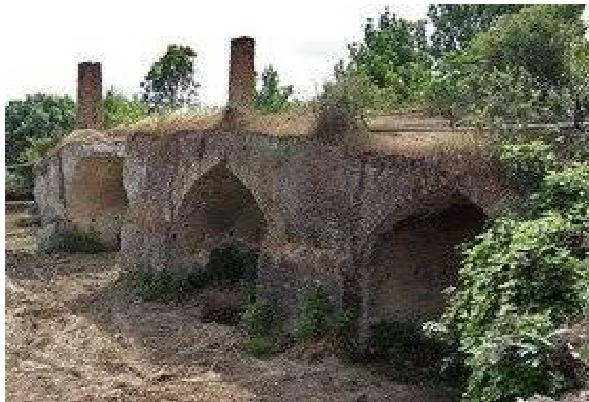
عکس ۱۴- گرمابه روستای بالااشتوج. برگرفته از سایت خبرگزاری ایسنا، فروردین ۱۳۹۷

به اواخر دوره قاجار می‌باشد که سوخت مصرفی این حمام از هیزم بوده است که امروزه جز خرابه‌ای از آن باقی نمانده است (عکس شماره ۱۴).