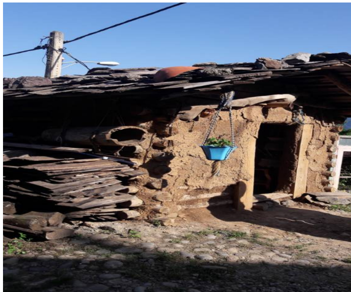
عکس ۱- نمای بیرونی تنورستان، تیر ۱۳۹۷، عکس: محققان