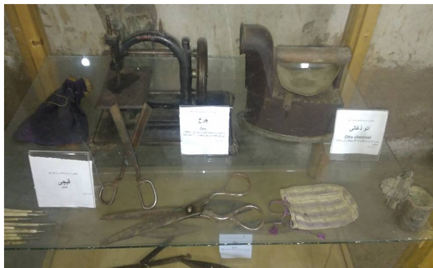
عکس ۹- اتو زغالی و وسایل خیاطی، موزه مردم‌شناسی برسه، دوهزار، فروردین ۹۷،