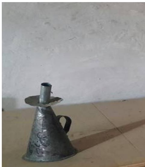
عکس ۱۶- چراغ موشی، موزه مردم‌شناسی برسه، دوهزار، فروردین ۹۷

چراغ موشی: به این نوع چراغ دست چراغ هم می‌گفتند. چراغ موشی تقریباً مشابه قوری‌های امروزی بود که از نوک لوله آن فتیله‌ای بیرون می‌آمد که آن فتیله آغشته به نفتی بود که داخل مخزن چراغ می‌ریختند. با گرفتن دسته چراغ موشی و روشن کردن فتیله آن برای رفتن به بیرون از خانه از آن استفاده می‌کردند. بعدها با آمدن فانوس، چراغ موشی‌ها به فراموشی سپرده شد (عکس شماره ۱۶).