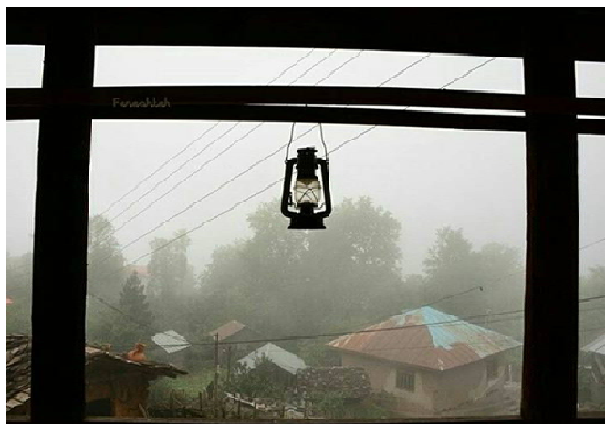
عکس ۱۷- فانوس، خانه روستایی در دوهزار، اردیبهشت ۹۷، عکس: محققان

فانوس را احاطه می‌کرد. در دو طرف مخزن ستون‌هایی تعبیه شده بود که دسته فانوس به آنها متصل می‌شد و برای حمل و نقل از دسته فانوس استفاده می‌کردند (عکس شماره ۱۷ و ۱۸).