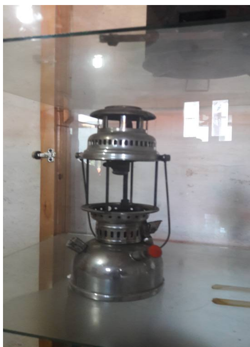
عکس ۲۱- چراغ سیتکا، موزه مردم‌شناسی برسه، دوهزار، تیر ۹۷

ساکنین با استفاده از تلمبه اقدام به پر کردن باد در مخزن چراغ می‌کردند. محفظه‌ای هم بر روی مخزن جهت قرار دادن شیشه و اتصال آن به دسته‌های چراغ تعبیه شده بود. برای روشن کردن چراغ سیتکا ابتدا توری را بر روی لوله نصب و آغشته به الکل می‌کردند و آن را آتش می‌زدند پس از چند لحظه توری این چراغ‌ها با کمک بخار نفت باعث روشنایی منزل می‌شد. توری‌های این چراغ پس از خاموش شدن چراغ‌ها به شکل لامپی کوچک بر روی لوله قرار داشتند و تا زمانی که از آن جدا نمی‌شد با اندکی الکل که در کف محفظه فوقانی چراغ می‌ریختند دوباره روشن می‌شد و قابل استفاده بود (عکس شماره ۲۱).