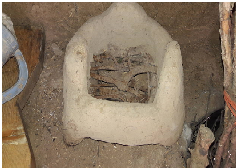
عکس ۷- کوره فرنگی، موزه مردم‌شناسی برسه، دوهزار، تیر ۹۷

جهت پخت‌وپز و یا گرم نگه‌داشتن غذا با استفاده از چیک ۱ یا همان زغال ۲ گداخته تعبیه می‌شد (عکس شماره ۷ و ۸). در گذشته و زمانی که هنوز برق نبود برای اتو کردن لباس‌ها در اتو از چیک استفاده می‌شد (عکس شماره ۹).