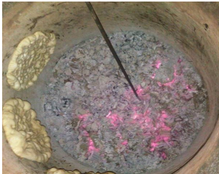
عکس ۲- نمای داخلی تنورستان، تیر ۱۳۹۷، عکس: محققان