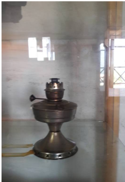
عکس ۲۰- لمپا گردسوز، موزه مردم‌شناسی برسه، دوهزار، تیر ۹۷

چراغ سیتکا ۱ : چراغ سیتکا یا چراغ‌زنبوری از جنس استیل بود. این چراغ‌ها مخزنی برای ریختن نفت داشتند که لوله‌ای از وسط این چراغ به بالا که سر این لوله به شکل یو (u) رو به پایین بود وجود داشت که محل نصب توری مخصوص این چراغ‌ها بود. این چراغ‌ها با استفاده از فشار باد و بخار حاصل از گرم شدن نفت که به توری افشاند می‌شد روشن می‌ماند و نور آن از دیگر چراغ‌هایی که تاکنون شرح داده شد بیشتر بود. اهرمی تلمبه مانند در بدنه مخزن جهت تأمین فشار باد نصب می‌شد که به محض کم شدن نور چراغ