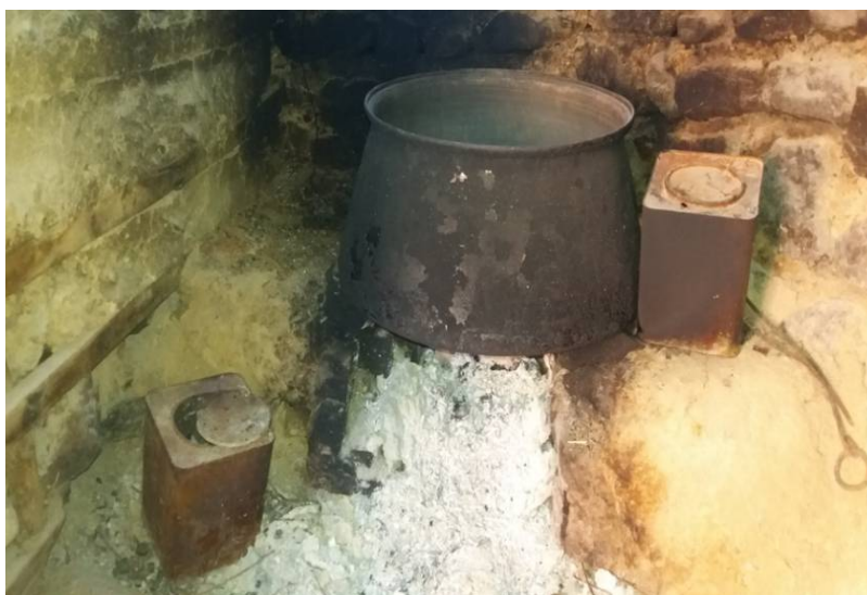
عکس ۱۳- کرجال و دیگ بزرگ برای گرم کردن آب جهت استحمام، روستای درجان سه هزار، مرداد ۹۷

پس از ورود نفت به این دهستان‌ها سطح رفاهی و بهداشت افراد بالاتر رفت. قبل از آن ساکنین روستاها جهت استحمام به صورت دسته‌جمعی از روستای خود به روستایی دیگر که دارای گرمابه بود طی طریق می‌کردند. غالباً هر چند روستا دارای یک گرمابه بودند. افراد روستاهای مختلف قبل یا حین و یا بعد از استحمام همدیگر را می‌دیدند و از احوال یکدیگر و وضعیت روستاهای هم باخبر می‌شدند. در این گرمابه‌ها از هیزم برای گرم کردن آب استفاده می‌کردند و حمام زیر نظر یک نفر که به او حمام‌چی می‌گفتند نگهداری می‌شد (عکس شماره ۱۳).