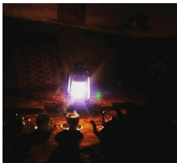
عکس ۱۸- فانوس، خانه روستایی در دوهزار، اردیبهشت ۹۷