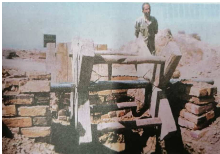
عکس ۱- چرخ چاه (عکس پشت جلد کتاب قنات قصبه گناباد)

به احتمال بسیار زیاد و به دلایل عقلی مادر چاه و سایر چاه‌ها در قنات‌های اولیه (در ۳۰۰۰ سال قبل) کم عمق بوده است. هرچه در طول زمان قنات‌ها تکمیل تر شده‌اند بر عمق و تعداد چاه‌ها و طول کوره‌ها افزوده شده است. پس می‌بایست چرخ چاه‌ها تکمیل تر و مقاوم تر می‌شدند. وقتی عمق چاه زیاد می‌شد تعداد افرادی که می‌بایست چرخ چاه را بچرخانند بیشتر می‌شد و گاه نیاز بود دو گروه در دو طبقه چرخ را بچرخانند. گاه تعداد چرخکش‌های یک دستگاه چرخ به ۵ و ۶ نفر می‌رسید که باید در دو طبقه پا را روی پدال چرخ می‌گذاشتند.