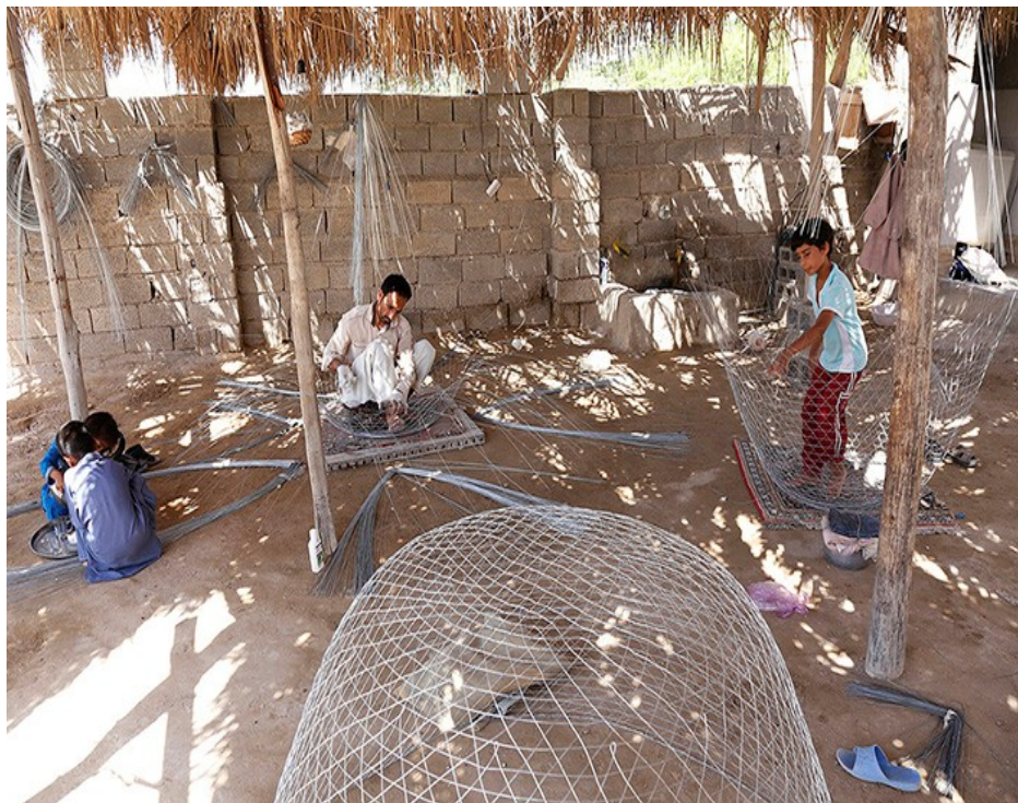
شکل ۲- کارگاه گرگوربافی در گناوه (محقق، ۱۳۹۵)