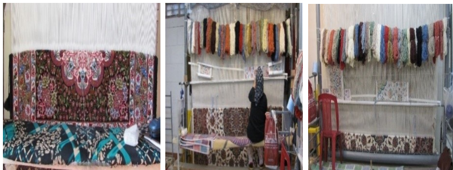
عکس ۶- نمونه‌هایی از قالی‌های در حال بافت جیریا