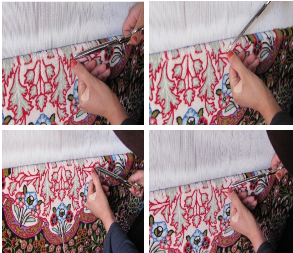
عکس ۳- نحوه آراشت (آرایش کردن) در قالی جیریا

تقریباً در همه مناطق مختلف ایران به استثنای برخی تفاوت‌ها بکار می‌رود. یکی از تفاوت‌های قالی جیریا همچون سایر تفاوت‌ها نظیر بافت و کیفیت بافت، مقوله "پرداخت" و به اصطلاح محلی مرحله "آراشت" (آرایش) کردن قالی است که پس از اتمام چند رج اتفاق می‌افتد. بدین صورت که بافنده با قیچی مخصوص پرداخت، با برش و دورگیری بسیار محتاطانه و ظریف گونه از امتداد برخی گل‌ها، سعی در برجسته‌سازی برخی ساقه‌ها، گل‌ها و گلبرگ‌ها می‌کند (عکس ۳).