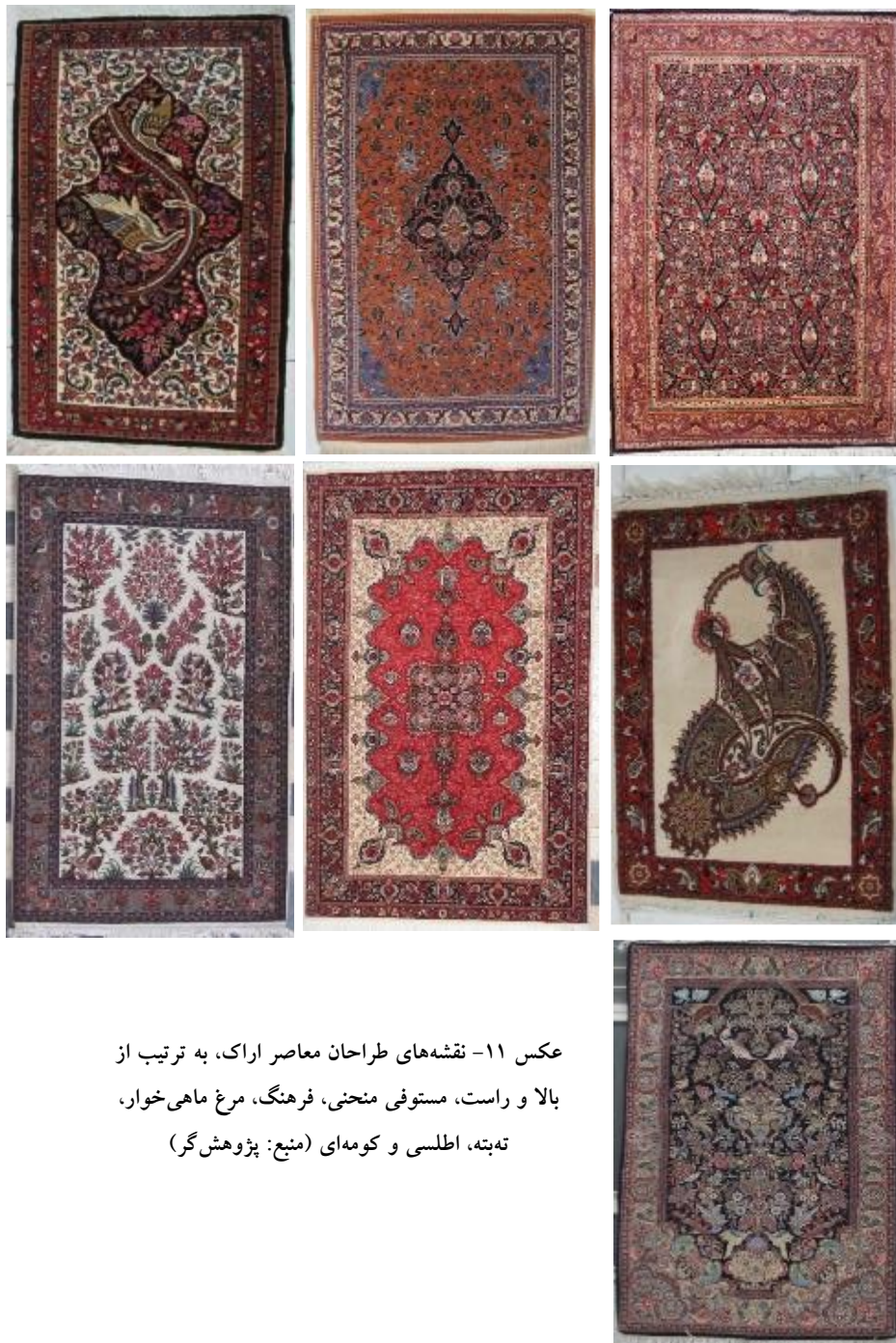
عکس ۱۱- نقشه‌های طراحان معاصر اراک، به ترتیب از بالا و راست، مستوفی منحنی، فرهنگ، مرغ ماهی خوار، ته‌بته، اطلسی و کومه‌ای