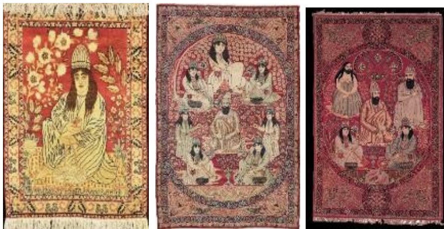
تصویر ۹- نمونه‌هایی از قالی‌های درویشی و شمایل نورعلیشاه