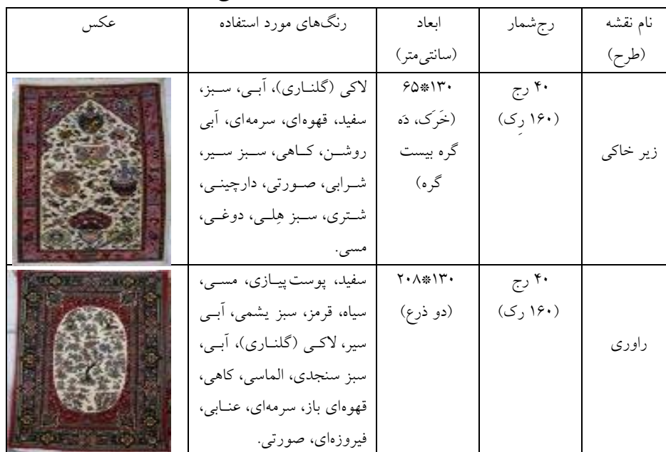
جدول ۵- مختصات نقشه‌های غیربومی جیریا