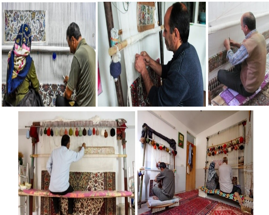
عکس ۲- مردان بافنده قالی در جیریا