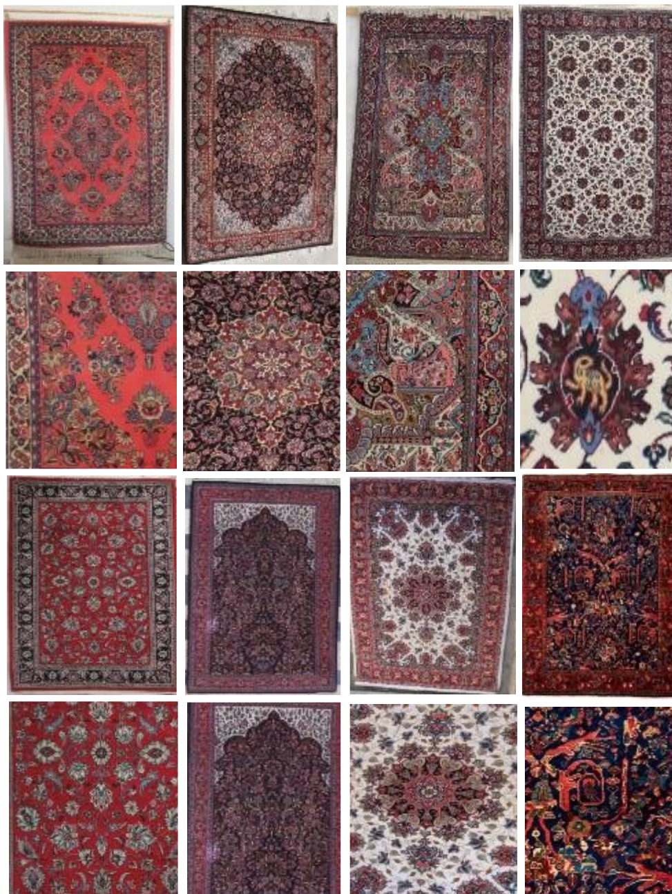
عکس ۷- نمونه‌هایی از نقشه‌های بومی بافت جیریا، به ترتیب از بالا و از راست، افشان کله‌گاو، جغرافیا، لچک و ترنج خورشیدی، دسته‌گلی جغرافیا، سوار آبادی و افشان شاه‌عباسی