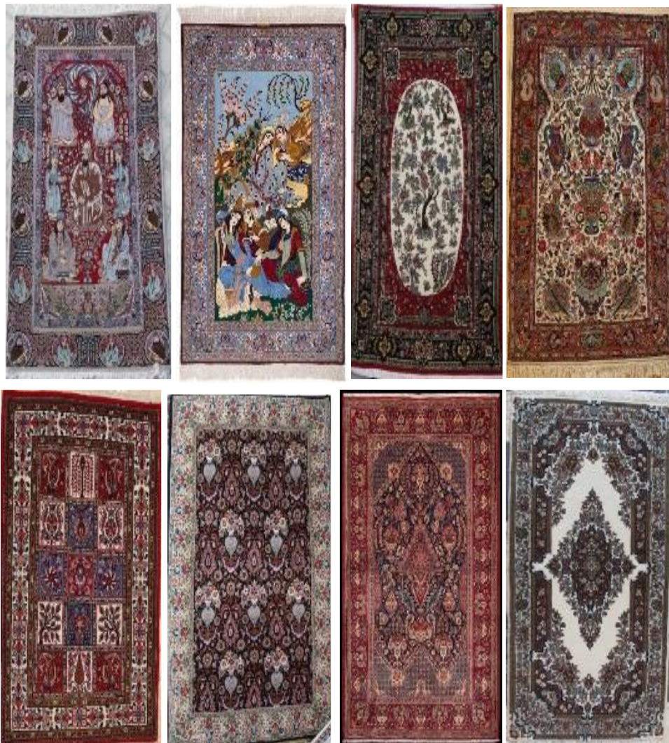
تصویر ۸- نمونه‌هایی از نقشه‌های غیربومی بافت جیریا، به ترتیب از بالا و از راست، زیرخاکی، راوری، منظره خیام، هفت درویش، قاب قرآنی، حاج خانمی، ظل السلطان و خشتی