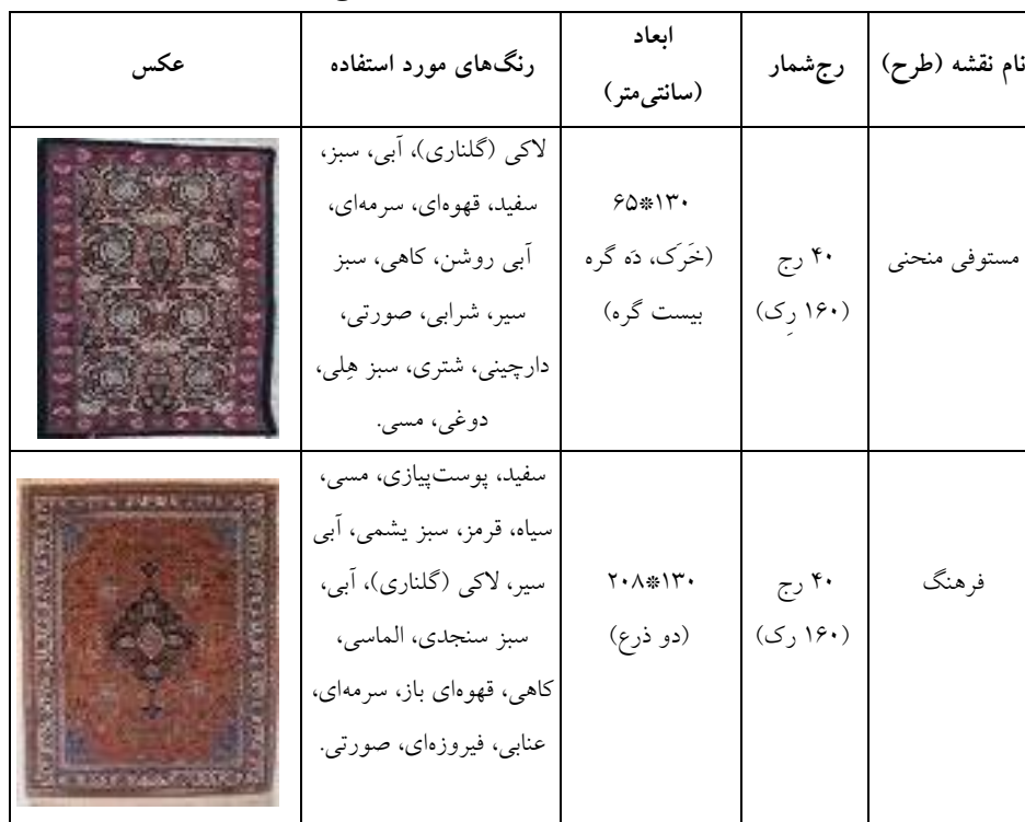
جدول ۶- مختصات نقشه‌های طراحان معاصر