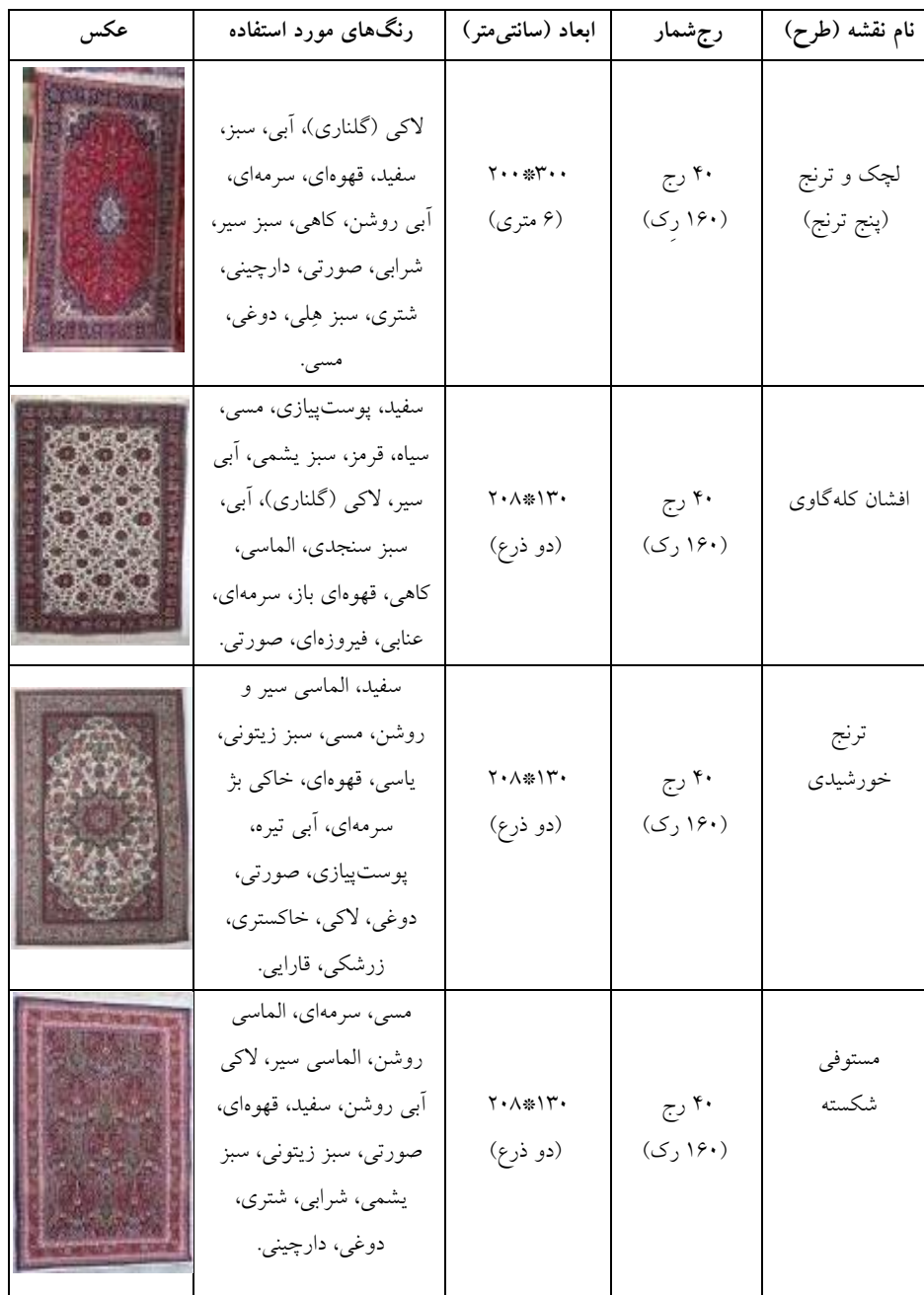
جدول ۴- مختصات نقشه‌های بومی جیریا