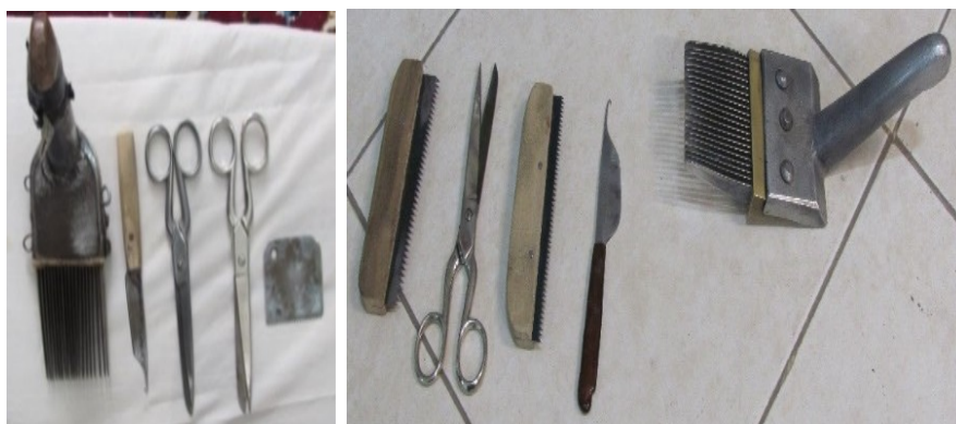
عکس ۴- ابزار بافندگی در قالی جیریا

عرضی قالی. میزان محاسبه نقشه قالی در اراک بر اساس رک یا رک‌شمار در مقیاس \frac{1}{4} یا (یک چارک) معادل ۲۶ سانتی‌متر \frac{1}{4} زرع است. اما رج در میزان محاسبه رج‌شمار، معادل \frac{6}{5} سانتی‌متر یک گره زرعی است. ۱ قالی جیریا بر اساس کیفیت در رک‌شمار ۱۶۰، ۱۸۰ و ۲۰۰ (رج‌شمار ۴۰، ۴۵، ۵۰)، تولید می‌شود و هیچ‌گاه از رک‌شمار ۱۶۰ یا رج‌شمار ۴۰، پایین‌تر نیست. ابعاد و اندازه‌ها به‌عنوان مؤلفه‌ای دیگر در قالی جیریا، مختلف و متنوع است. بسته به نوع سفارش و یا تصمیم بافنده انتخاب و بافته می‌شود. در شکل، ابعاد و اندازه‌های قالی جیریا ذکر شده است. ابعاد قالی‌هایی که در جیریا بافته می‌شود، متنوع است. اما به‌طور عمده بافت قالی با اندازه‌های دو زرع، شش متری و در برخی مواقع هفت متری، در این منطقه رایج است از این‌رو که به گفته اهالی از منظر اقتصادی و استقبال خریداران صرفه مطلوب‌تری دارد. در جدول ۲، اندازه‌های مختلف قالی‌های جیریا نشان داده است.