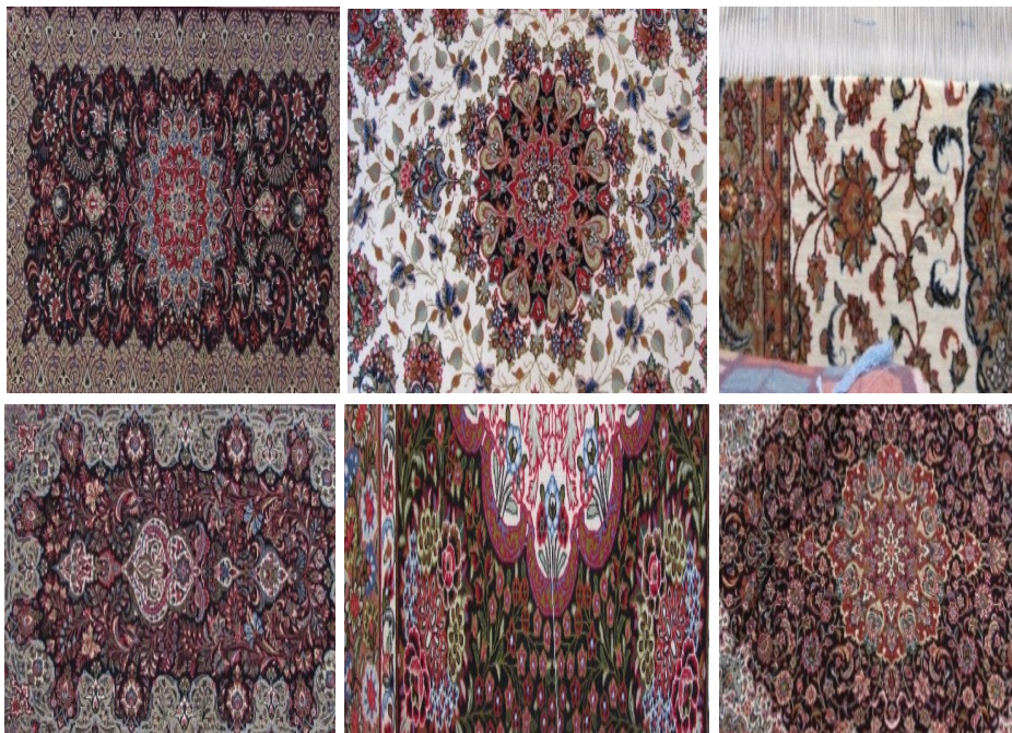
عکس ۵- نمونه‌هایی از رنگ‌بندی قالی‌های جیریا