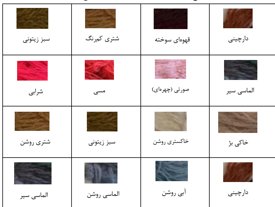
جدول ۳- انواع رنگ‌های به‌کاررفته در قالی جیریا (منبع: پژوهش‌گر)