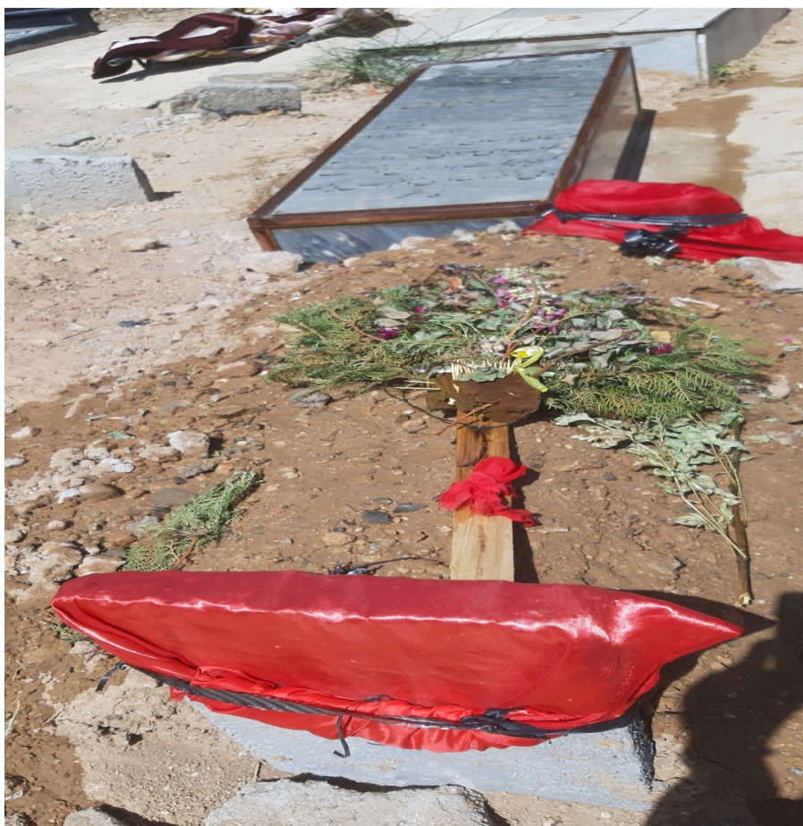
عکس ۲- قبر جوان مجرد، شجاع‌آباد، ۱۴۰۰

سینی را پارچه مشکی می کشیدند. ممکن بود هر کدام از اطرافیان و خویشاوندان نیز یک سینی به همان گونه که شرح داده شد درست می کردند و برای خانواده متوفی می آوردند. سینی را هر بار که به گورستان می رفتند با خود می بردند و روی قبر قرار می دادند بعد از اینکه مراسم تمام می شد کله قند را کنار متوفی خاک می کردند. سیب‌ها را نیز بروی قبر جا می گذاشتند. این رسم برای تمامی جوانان اعم از دختر و پسر انجام می شد. البته داغ پسر سنگین تر بود.