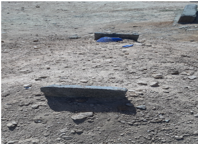
عکس ۳- کوزه شکسته بر قبر، شجاع‌آباد

"مو نماد زندگی است و در بسیاری از فرهنگ‌ها با سوگواری مرتبط است" (میتفورد، ۱۳۹۶: ۱۳۰). یکی از آیین‌ها و سنن سوگواری کندن و بریدن مو در میان زنان خانواده است. آن‌ها زمانی که خبر مرگ عزیز خود را می‌شنیدند موهای بافته شده‌ای خود را به نشانه عزا و ماتم بزرگ قیچی کرده و بروی جنازه می‌انداختند. این کار را معمولاً خواهران و مادران انجام می‌دادند و در آخر آن را داخل سینی تزیین شده می‌گذاشتند. یا اینکه با شنیدن و دیدن مرگ عزیزشان شروع به کندن موهای خود می‌کنند. بعضی از آن‌ها گونه خود را از بالا به پایین خراش می‌انداختند به نوعی که گاه خون از آن جاری می‌شد. بعد از اینکه خانواده یکی از عزیزانش را از دست می‌داد و فوت می‌شد بر روی قبر فرد متوفی یک کوزه می‌شکستند و روی قبر او می‌گذاشتند چون معتقد بودند که ایشان در زمان نحسی فوت شده (جمعه، غروب و ...) که کسی دیگری را همراه خودش نبرد. پس برای اینکه دیگر اعضای خانواده از مرگ به دور باشند و دیگر این حادثه غمناک برایشان تکرار نشود کوزه یا ظروف سفالین دیگری را می‌شکنند.