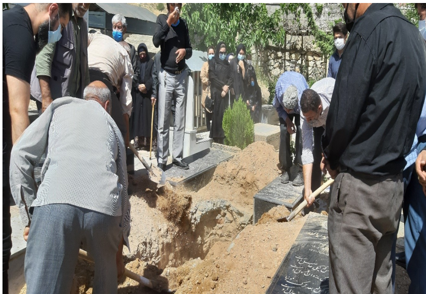
عکس ۱- نحوه خاک ریختن بر قبر، شجاع‌آباد، ۱۴۰۰

زمین قبرستان متعلق به تمام روستا هست و فضای عمومی قلمداد می‌شود. در این زمان ممکن است شخص متوفی در گذشته به کسی بدهکار بوده باشد و در طول حیات خودش توان پرداخت بدهی را نداشته باشد. شخص بستانکار ممکن است در این شرایط در ته دل خویش یا با در جریان قرار دادن فرزندان و خانواده متوفی ایشان را حلال کند. معمولاً تا زمان غروب آفتاب یکی دو نفر در کنار قبر متوفی می‌مانند، بر روی قبر متوفی قرآن قرائت می‌کنند و اگر شب باشد تا صبح کنار قبر آتش روشن می‌کنند و می‌مانند و اعتقاد دارند که نباید مرده را تنها گذاشت چون می‌ترسد. اگرچه در خیلی از مواقع و بخصوص در گذشته متوفی را شب دفن نمی‌کردند بلکه ایشان را در خانه یا مسجد بعد از غسل و کفن نگه می‌داشتند و تا روز بعد در کنارش می‌نشستند و قرآن می‌خواندند.