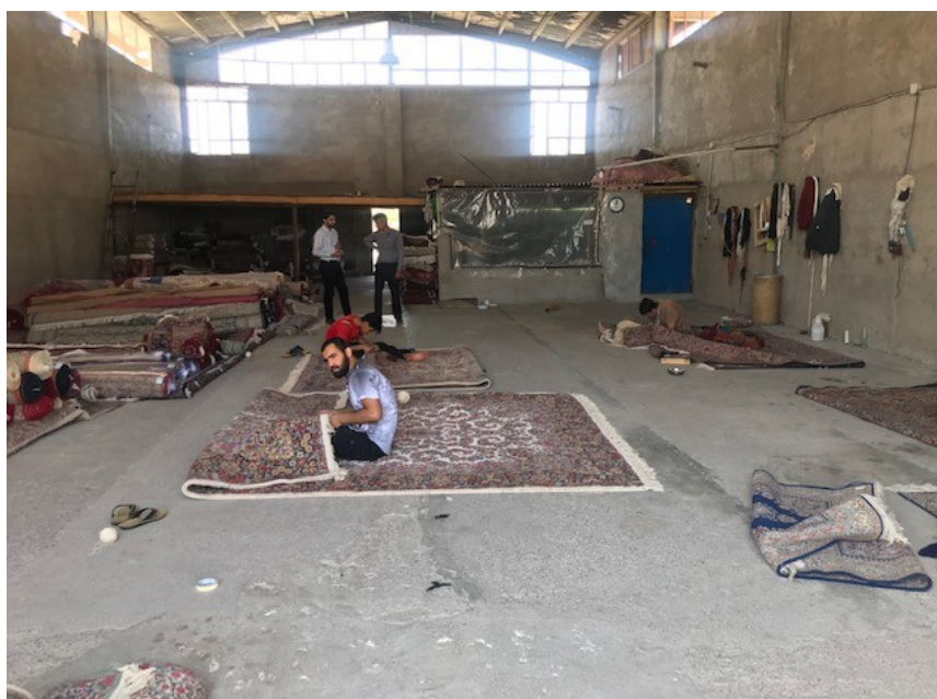
عکس ۵- کارگاه رفو و پرداخت فرش. (اعظم موسوی. ۱۳۹۸. کرمان)