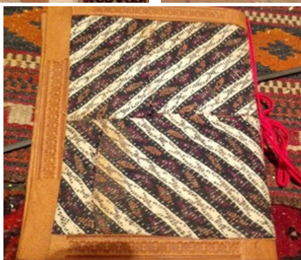
عکس‌های ۱۰- نمونه‌هایی از هنر استاد اسلام‌پناه در زمینهٔ صحافی کتاب و هنر چرم.