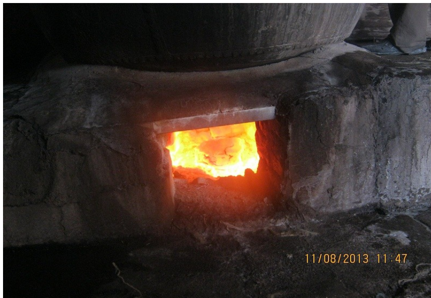
عکس ۱۱- مخزن آتش که با گاز شهری کار می‌کند. (نویسنده. مرداد ماه ۱۳۹۲)