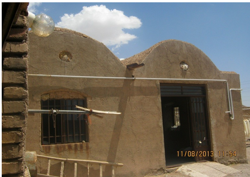
عکس ۲۲-نمای بیرونی کارگاه. (نویسنده. مرداد ماه ۱۳۹۲)