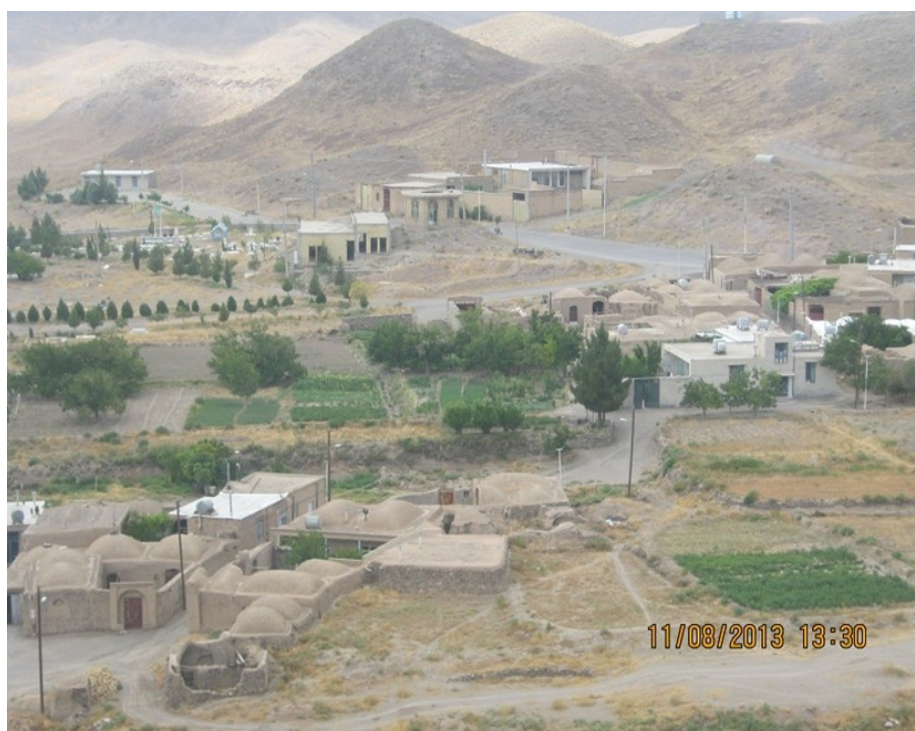
عکس ۱- نمایی کلی از روستای جشوقان. (نویسنده. مرداد ماه ۱۳۹۲)

روستای جشوقان بلحاظ کشاورزی محصول خاصی ندارد و از محصولات آن می‌توان از شلغم و انار نام برد. این روستا همان طور که از سر در مسجد جامع آن که متعلق به اواخر قرن دهم است، بر می‌آید در دوره صفویه محل زندگی گروه‌هایی از اشراف بوده که از آن جمله می‌توان به خاندان میر جلال الدین امیر اشاره کرد. امروزه جمعیت اصلی جشوقان تشکیل شده است از دو گروه سادات و عام؛ که ساداتها با نام خانوادگی بنی‌طبا شناخته می‌شوند. یکی از مشاغل مهم این روستا در گذشته رنگرزی سنتی بوده است