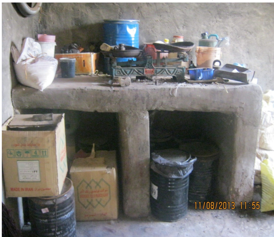
عکس ۱۴- نمایی از سکو یا میز کار و وسایل آن مانند ترازو و سرتاس... (نویسنده. مرداد ماه ۱۳۹۲)