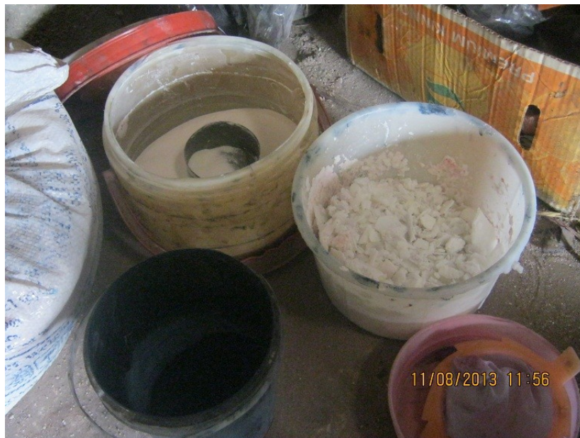
عکس ۱۵- مواد شیمیایی مورد استفاده. (سید آیت بنی طباء. مرداد ماه ۱۳۹۲)