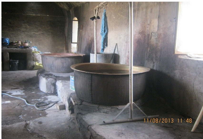
عکس ۱۲- سلابه: یا پایه که در بالای دیگ قرار می‌گیرد که نخ‌های رنگ شده را روی آن قرار می‌دهند.