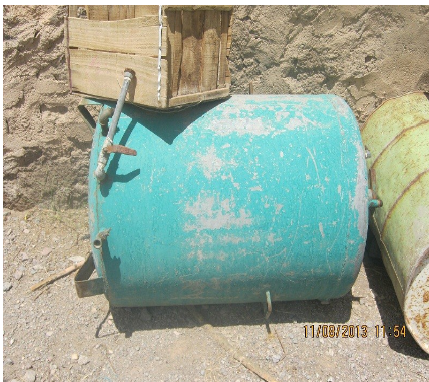
عکس ۹- کوره و بشکه