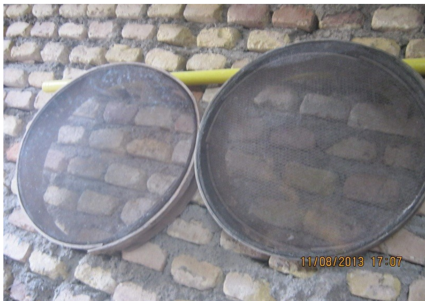
عکس ۱۸- دونمونه الک درشت و ریز. (نویسنده. مرداد ماه ۱۳۹۲)