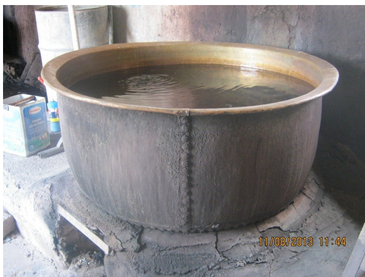
عکس ۶- کلک. (نویسنده. مرداد ماه ۱۳۹۲)

کلک (kalak): به محل و سکویی که پاتیل روی آن نصب می‌شود کلک می‌گویند.