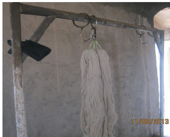
عکس ۲- کلاف (نویسنده. مرداد ماه ۱۳۹۲).

کلاف: ۲ دسته نخ می‌شود ۱ کلاف، که وزن آن حدود ۴۵۰ گرم است و هر ۱۰ کلاف می‌شود یک بقیچه.