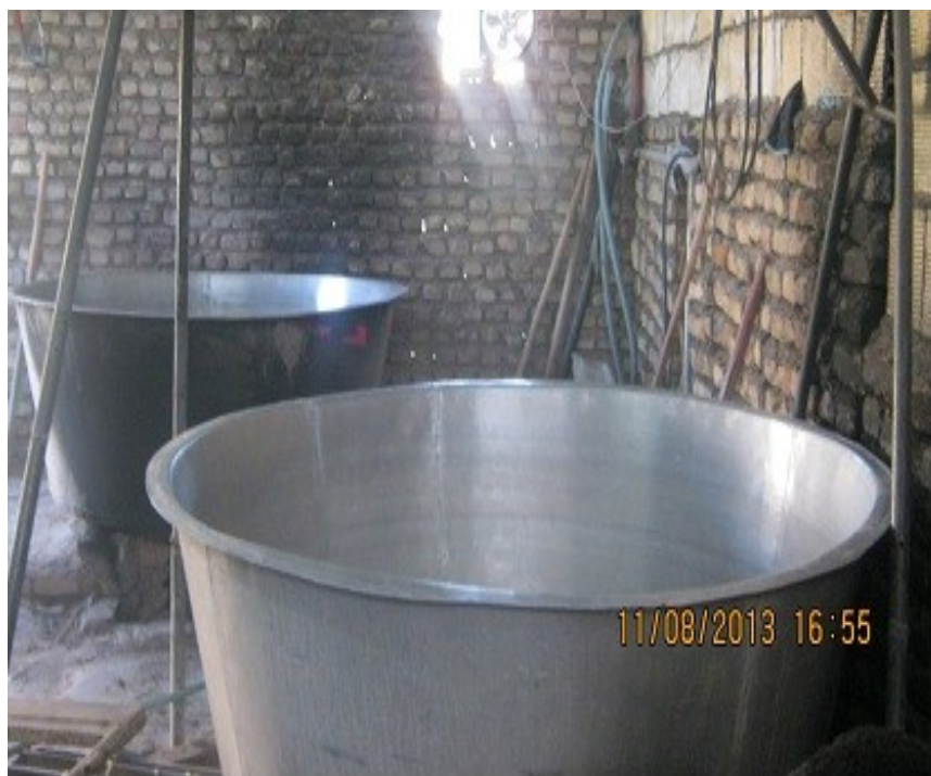
عکس ۸- پاتیل روحی. (نویسنده. مرداد ماه ۱۳۹۲)

دهانه ۱/۸۰ سانتی متر قطر بیرون: ۱۹۰ سانتی متر عمق: ۹۵ سانتی متر وزن: ۷۵ کیلو گرم گنجایش: ۲۷ کیلو گرم پشم از پاتیل روحی برای این که رنگ چرک نگیرد و پشم روشن نشان داده شود استفاده می‌شود. قارا: آب چکیده شده از ماست را که بجوشانیم پس از سفت شدن می‌شود قارا. در حدود ۱۰۰ سال پیش از قارا که همان قره قوروت است استفاده می‌شده است. در صورت نبود قارا از پوست لیموی آبگیری (ترش) استفاده می‌شده است.