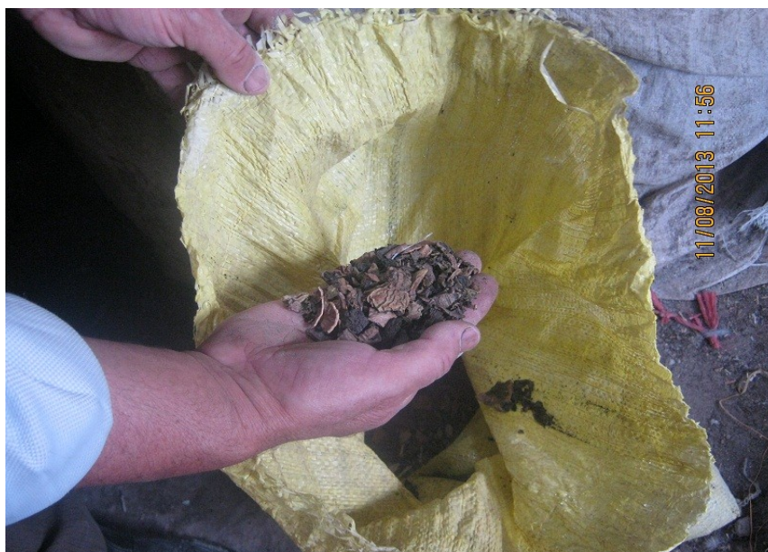
عکس ۱۶- پوست گردوی خشک شده. (نویسنده. مرداد ماه ۱۳۹۲)