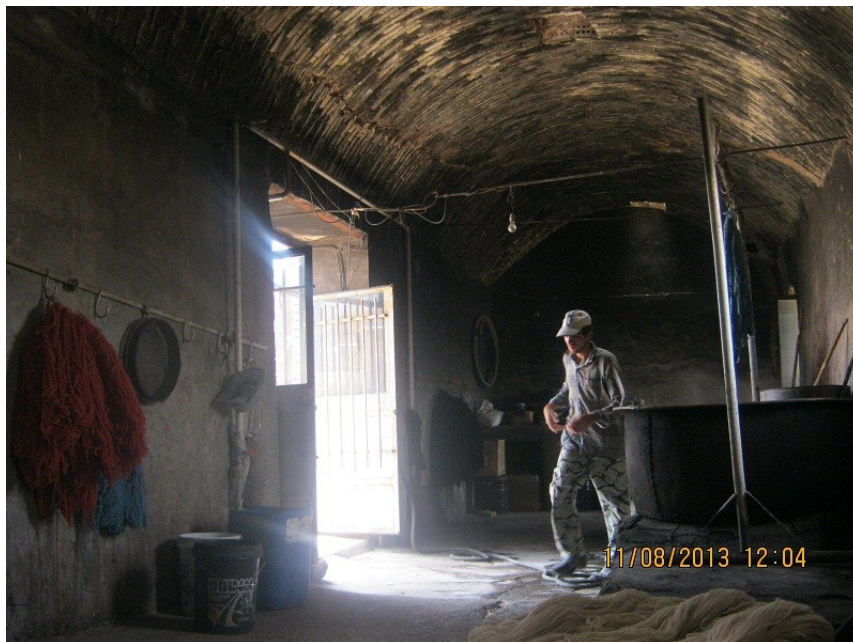
عکس ۱۷- نمایی از درون کارگاه و طاق ضریبی آن. (نویسنده. مرداد ماه ۱۳۹۲)