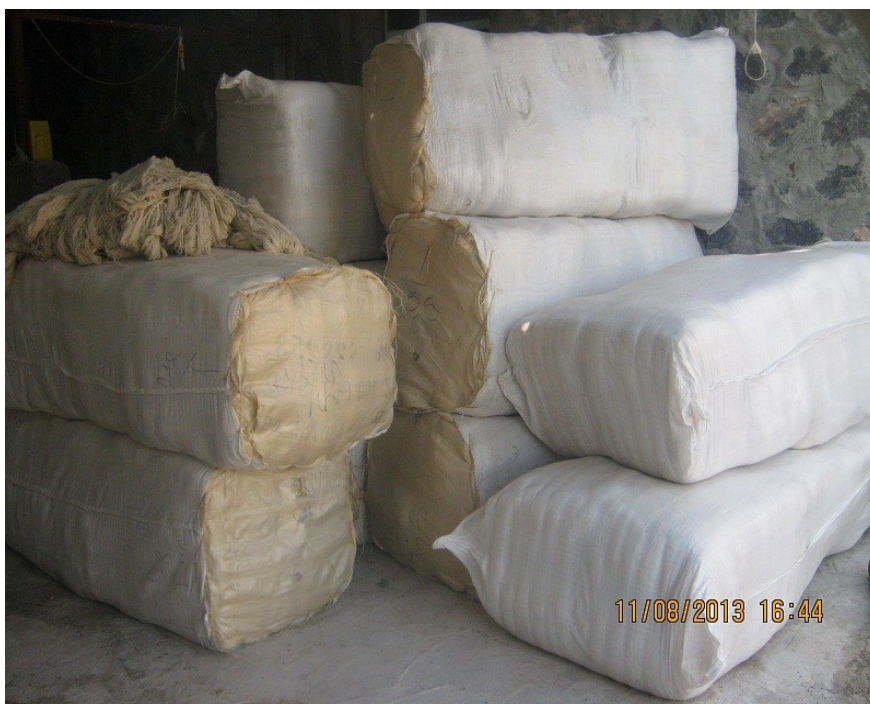
عکس ۴- عدل. (نویسنده. مرداد ماه ۱۳۹۲)

عدل: به بسته ۱۶ بقچه‌ای یا ۲۰ بقچه‌ای کلاف‌ها، عدل می‌گویند.