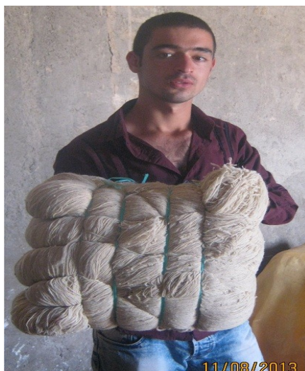
عکس ۳- بقیچه. (مرداد ماه ۱۳۹۲)

بقیچه: واحد سنجش مقدار پشم در کارخانجات ریسندگی است که معادل حدود ۴/۵ کیلوگرم است. هر ۱۰ کلاف می‌شود یک بقیچه.