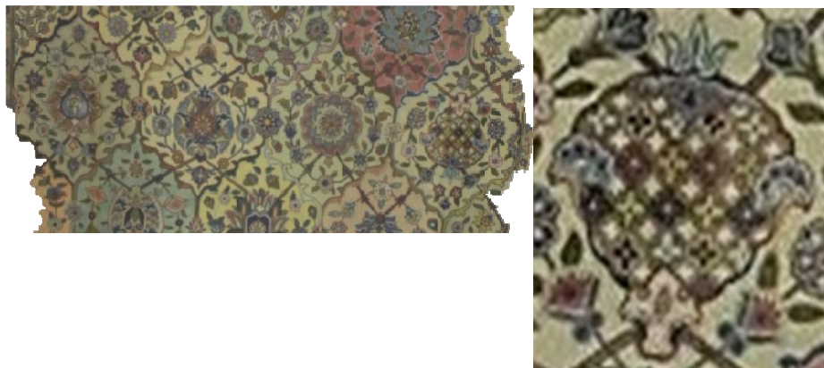
عکس ۱۰- نوعی از گل‌های ختایی دارای مغزی شبیه به شیرینی سنتی قزوین، از تولیدات کارخانه اعتماد، محفوظ در موزه شهر قزوین

ردیف هفتم نیز مانند ردیف‌های پنجم و سوم چیدمان شده است در نیم قاب‌هایش یکی شاه‌عباسی و دیگری نیم‌گلدان جانمایی شده است؛ اما سه قاب کامل نیز دارد که یکی دارای گلی گرد از نوع گل‌های چرخنده و فرفره‌ای و دو قاب دیگر دو شاه‌عباسی را نشان می‌دهند. نمونه‌ای از انواع برگ چناری‌ها و دیگری نوعی لاله عباسی با محیطی بسته را به منصفه حضور گذاشته است (عکس ۱۱)