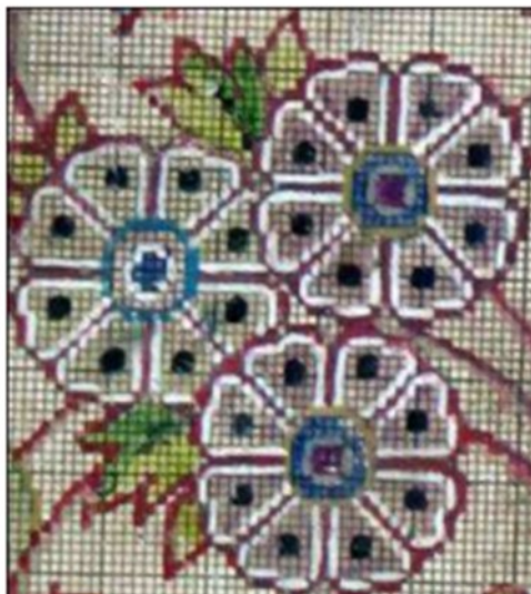
عکس ۱۳- نقش گل هشت پر یا شکوفه یا گل پسته، (شادلو، ۱۳۹۰: ۷۵)

با اینکه بیشتر نقوش در قالی ایرانی تجریدی بوده و وجوه بیانگری و توصیفی در قالی کم‌رنگ و یا بهتر است نوشته شود بی‌رنگ است؛ اما با توجه به اقلیم، طبیعت و رویدادهای یک منطقه باز هم تحت تأثیر قرار می‌گیرند. به‌طور مثال با وجود دو محصول مهم در باغداری و کشاورزی قزوین، پسته و انگور، شکوفه یا گل پسته و برگ انگور در پهنه قالی مشاهده می‌شود. مصاحبه پاییز ۱۳۹۰ نگارنده با برخی صاحب‌نظران حاکی از این ادعا بود. نگارنده در پی دریافت پاسخ این سؤال که به‌ظاهر بسیاری از قالی‌های اعتماد به قالی کاشان شبیه است، چگونه می‌توان در لایه سطحی به تفاوت آن دو اشاره نمود؟ چنین دریافت شد که: