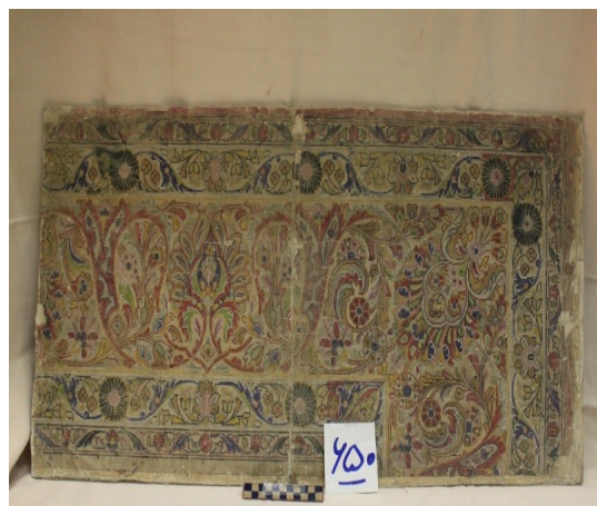
عکس ۱۸- بخشی از رنگ‌های به کار رفته در حاشیه قالی اعتماد قزوین، نگارنده

جدول ۱- بازتاب برخی ویژگی‌های قالی اعتماد در نمونه‌های مطالعاتی محفوظ در موزه شهر، مأخذ: نگارنده