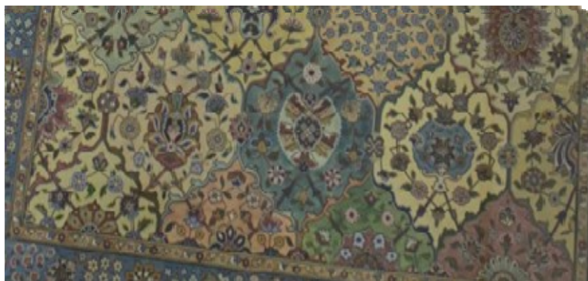
عکس ۸- ردیف دوم از نقشه قاب‌قایی، از تولیدات کارخانه اعتماد، محفوظ در موزه شهر قزوین

ردیف دوم متشکل است از چهار قاب کامل که سه نمونه دربردارنده طبقه شاه‌عباسی‌ها و یک نمونه گل هشت پر با گلبرگ اناری قابل مشاهده است (عکس ۸).