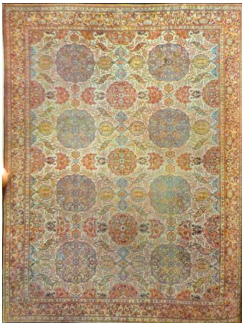
عکس ۵- قالی بندی یا واگیره‌ای، قزوین (بی‌نا، ۱۳۵۱: ۲۷)

«طرح قاب قابی در معماری قزوین بسیار کاربرد داشته و از طرفی قدیمی‌ترین فرش‌های (عکس ۵) که در سدهٔ اخیر به قزوین نسبت داده شده طرح واگیرهٔ قاب قابی داشته و تاریخ بافت آن به پیش از تأسیس کارخانه اعتماد بازمی‌گردد» (بی‌نا، ۱۳۵۱: ۲۷).