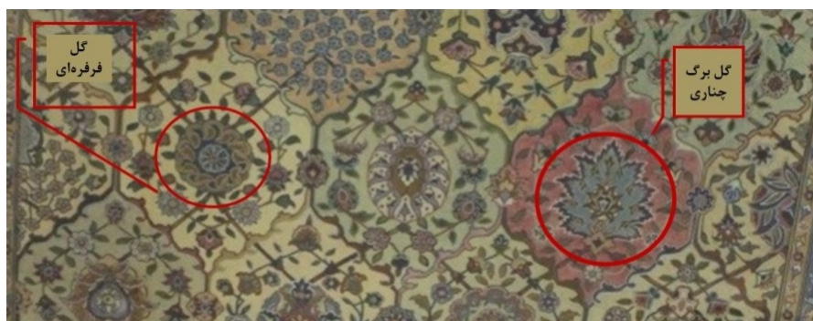
عکس ۱۱- گل گرد فرفره‌ای و گل برگ چناری در ردیف هفتم، از تولیدات کارخانه اعتماد، محفوظ در موزه شهر قزوین

ردیف هفتم نیز مانند ردیف‌های پنجم و سوم چیدمان شده است در نیم قاب‌هایش یکی شاه‌عباسی و دیگری نیم‌گلدان جانمایی شده است؛ اما سه قاب کامل نیز دارد که یکی دارای گلی گرد از نوع گل‌های چرخنده و فرفره‌ای و دو قاب دیگر دو شاه‌عباسی را نشان می‌دهند. نمونه‌ای از انواع برگ چناری‌ها و دیگری نوعی لاله عباسی با محیطی بسته را به منصفه حضور گذاشته است (عکس ۱۱)