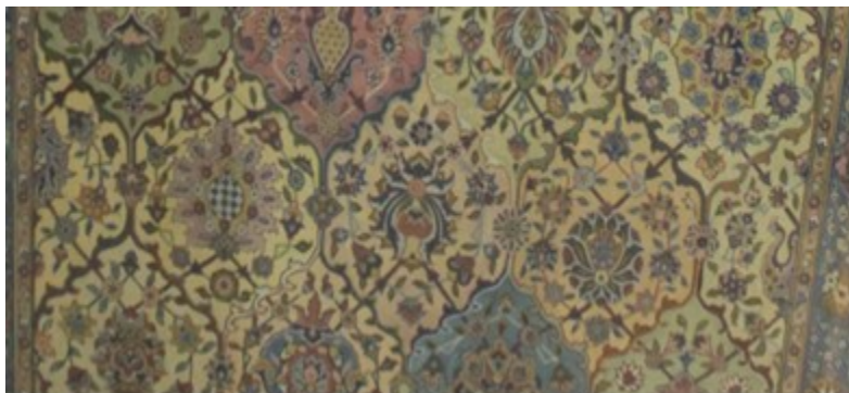
عکس ۹- ردیف سوم از نقشه قاب‌قابی، از تولیدات کارخانه اعتماد، محفوظ در موزه شهر قزوین

ردیف چهارم مشتمل است بر چهار قاب کامل و گل‌های میانی نیز شامل یک نمونه گل گرد و یک شاه‌عباسی از نوع شعله‌ای یا شراره‌ای، نمونه‌ای از گلدان و در یکی از بندها قاب-اسلمی طراحی شده است.