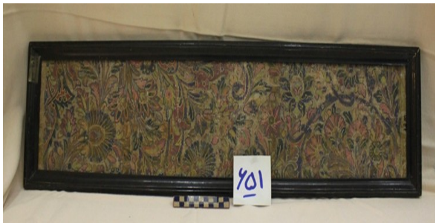
عکس ۲- بخشی از نقشه متن قالی اعتماد، مأخذ: نگارنده

نمونه شماره دو - تصویر بخشی از متن قالی اعتماد به شماره ۶۵۱ در مخزن موزه