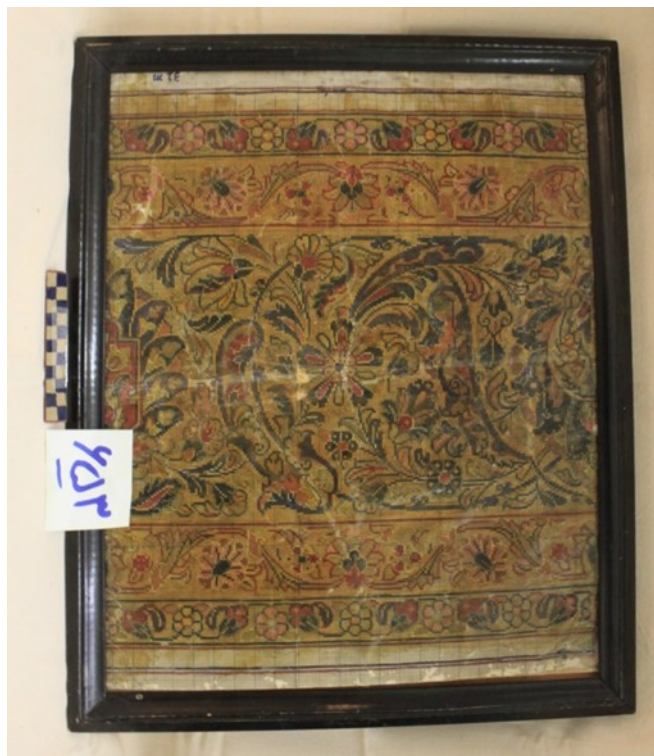
عکس ۳- بخشی از حاشیه قالی کارخانه اعتماد

نمونه شماره سه - تصویر بخشی از متن قالی اعتماد به شماره ۶۵۳ در مخزن موزه