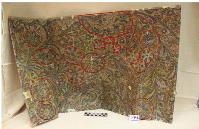
عکس ۱۴- نمایش تکثر ختایی‌ها در نقشه قالی اعتماد