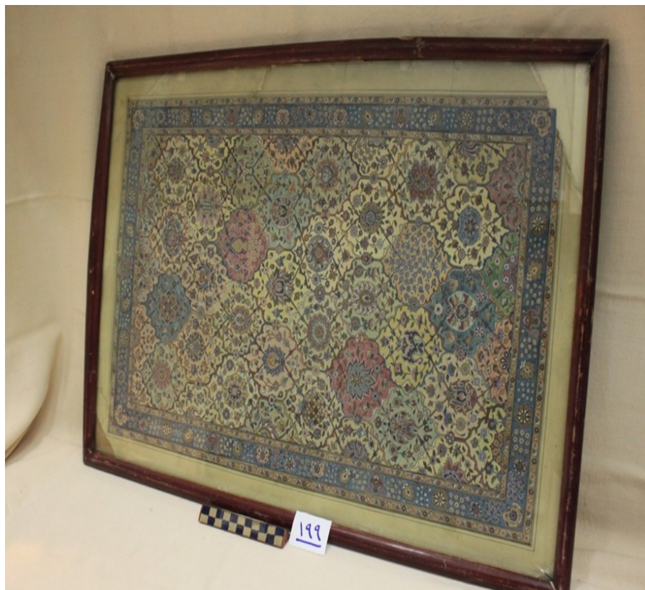
عکس ۴- نقشه قاب قابی از میان طرح‌های قالی اعتماد، محفوظ در موزه شهر قزوین، مأخذ: نگارنده

نمونه شماره چهار- تصویر بخشی از متن قالی اعتماد به شماره ۱۹۹ در مخزن موزه