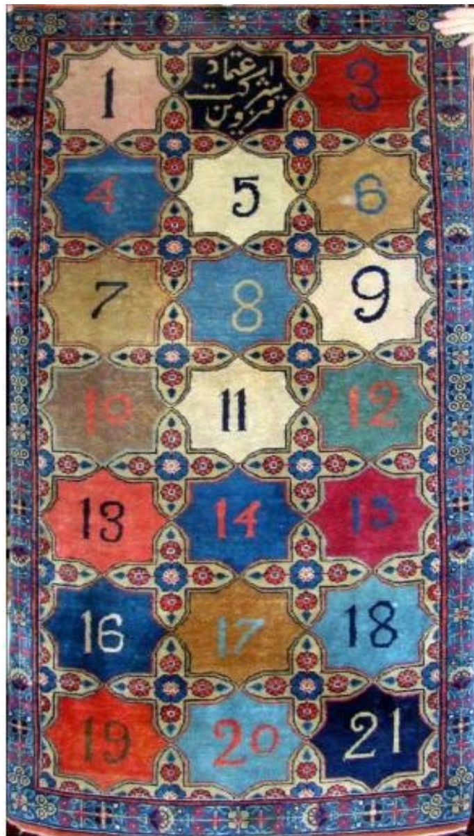
عکس ۶- شماره‌گذاری رنگ‌های مورد استفاده (پالت رنگی) در کارخانه قالی اعتماد،

طرح شمسه و بازوبندی، (شادلو و دیگران، ۱۳۹۰: ۹۷)