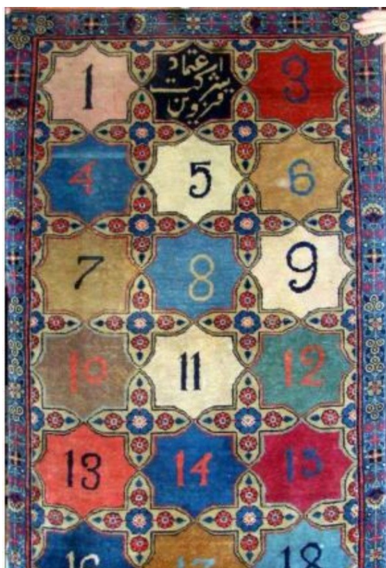
عکس ۱۶- طیف رنگ‌های به کاررفته در قالی‌های کارخانه اعتماد

تنوع رنگ و نقش: با توجه به عکس ۱۶ که پالت یا مجموعه رنگ‌های تکرارشونده در قالی اعتماد است، به نظر می‌رسد طیف رنگی وسیعی به کاررفته است (عکس ۱۶).