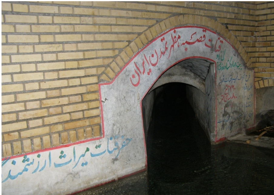
عکس ۱- نمایی از مظهر کاریز قصبه گناباد (ساکماق، بی تا: ۱۰۱۲۷۲).