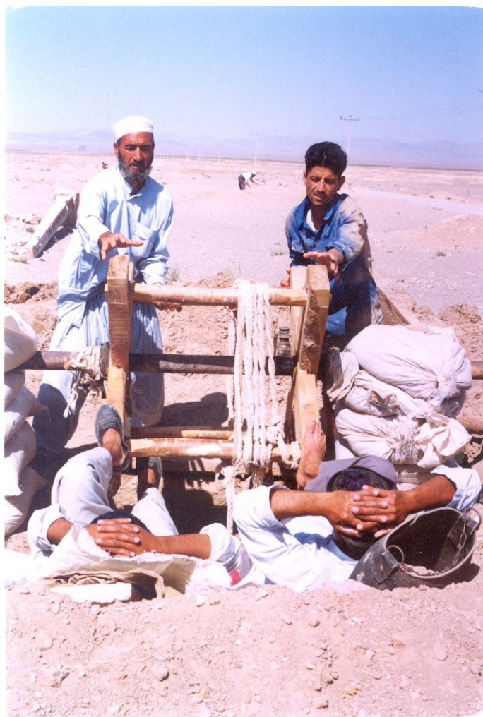
عکس ۳- لارویی و حفر کاریز در جنوب خراسان (ساکماق، ۱۳۸۹: ۳۱۲۶۵).

در هر ماه یک مرتبه به درون آن رود و اطراف و جوانبش را به دقت بررسی کند تا اگر در محلی مقداری گل ریزش کرده، بلافاصله براشته شود. دیگر اینکه در آغاز هر سال کاریز را از رسوبات لارویی و تنقیه کنند.» (کرجی، ۱۳۴۵: ۱۲۱-۱۲۰).