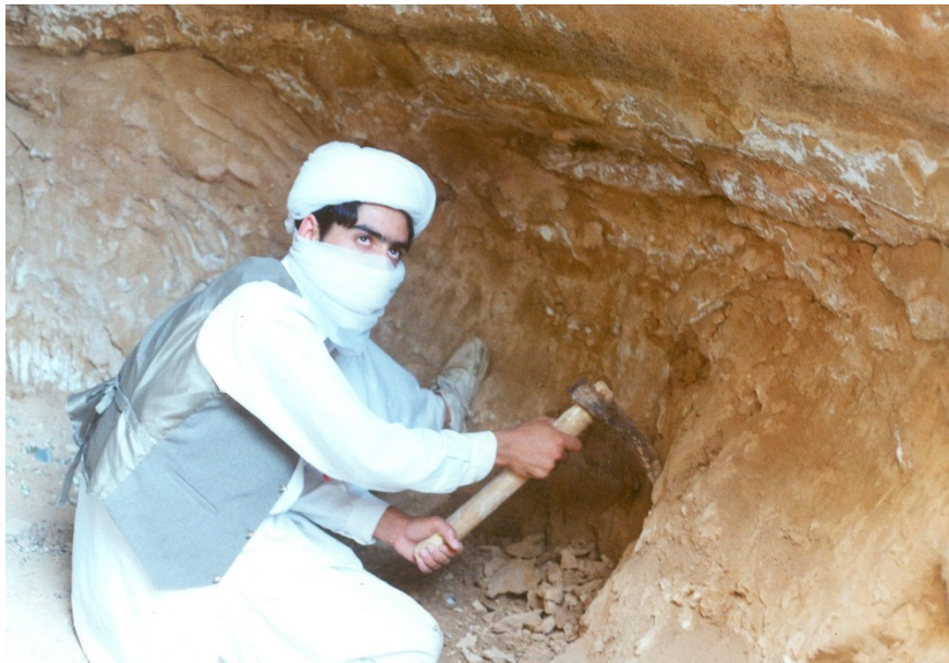
عکس ۱- کاریز کنی در تربت جام (ساکماق، ۱۳۸۹: ۳۱۲۳۹).